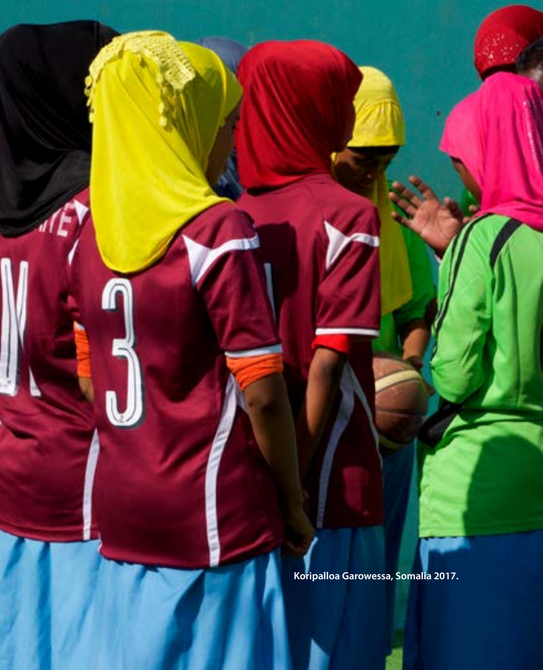
Koripalloa Garowessa, Somalia 2017.