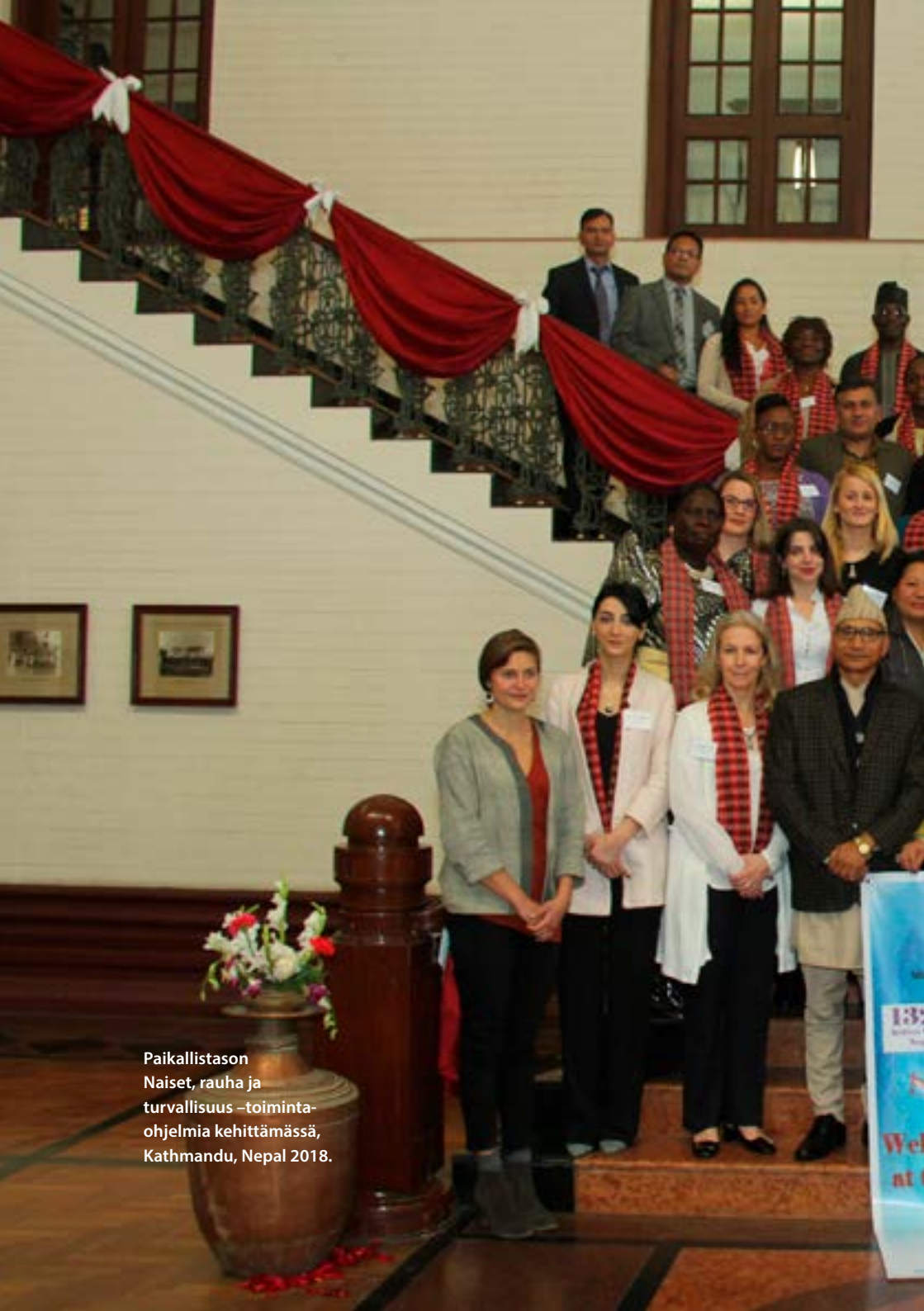
Paikallistason Naiset, rauha ja turvallisuus –toiminta- ohjelmia kehittämässä, Kathmandu, Nepal 2018.