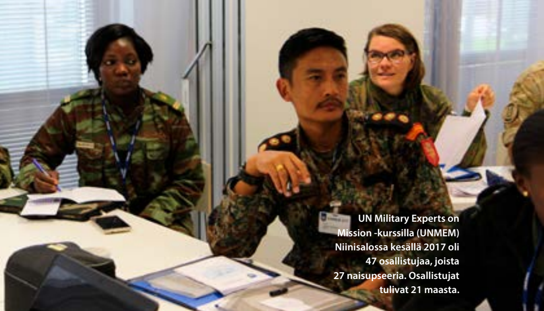
UN Military Experts on Mission -kursilla (UNMEM) Niinissalossa kesällä 2017 oli 47 osallistujaa, joista 27 naisupseeria. Osallistujat tulivat 21 maasta.

osa-alueisiin. Suomi osallistuu sukupuolinäkökulman integroimiseen kriisinhallinnan kansainväliseen koulutukseen ja valmiuksien kehittämiseen YK:ssa, EU:ssa, Etyjissä, sekä Afrikan Unionin kumppanina.