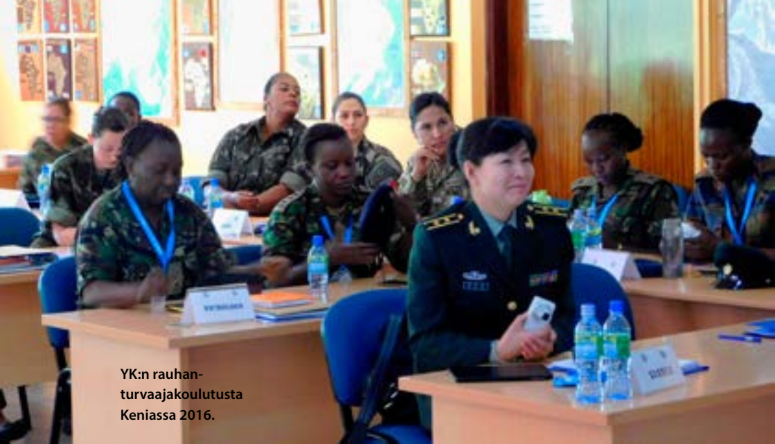
YK:n rauhan- turvaajakoulutusta Keniaassa 2016.

Suomalainen sotilaallisen ja siviilikriisinhallinnan henkilöstö noudattaa sekä kriisinhallintaoperaation toimeenpanevan järjestön että suomalaisten viranomaisten hyväksymiä käytännesääntöjä. Suomi korostaa seksuaalisen hyväksikäytön kaikissa muodoissa olevan rikos. Kaikki hyväksikäyttöepäilyt tutkitaan Suomen lainsäädännön mukaisesti. Suomi kiinnittää erityistä huomiota siihen, että kansainvälisten järjestöjen käytännesäännöt ehkäisevät syrjintää ja hyväksikäyttöä, että operaation johto noudattaa sääntöjä täysimääräisesti ja että hyväksikäyttöepäilyt tutkitaan viiveettä.