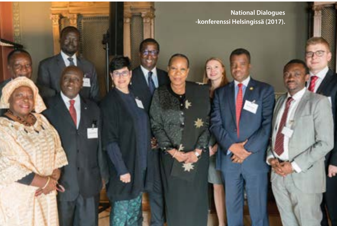
National Dialogues -konferenssi Helsingissä (2017).