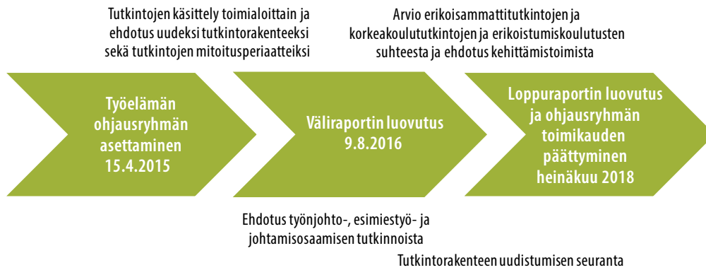
Kuvio 1. Työelämän ohjausryhmän työskentelyaikataulu