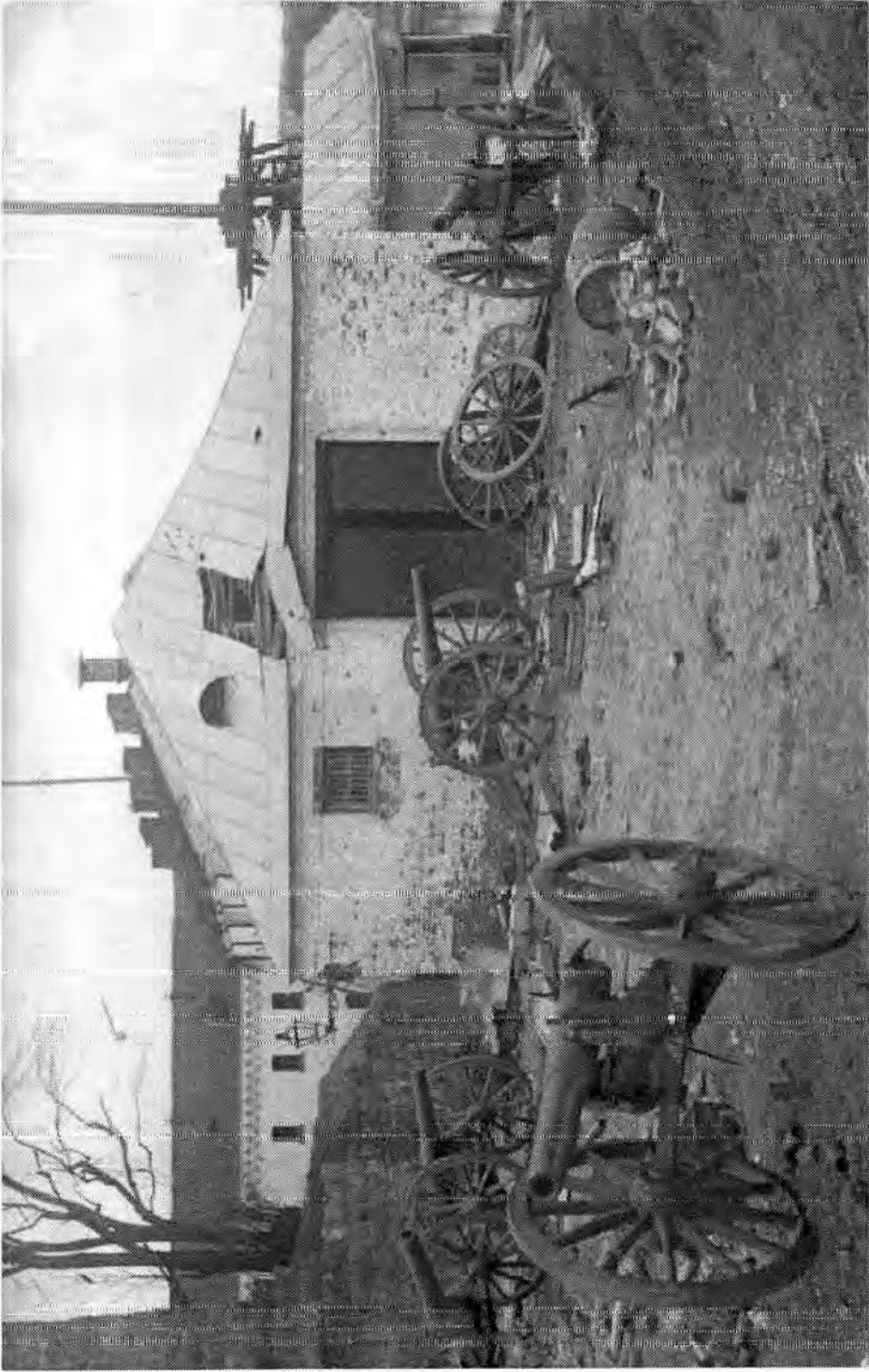
Viiipurin linnanpiha valloituksen jälkeen.