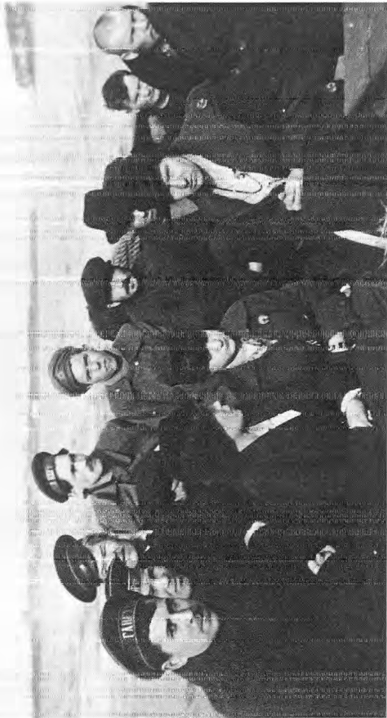
Kuvassa: Santahaminaan Suomenlinnan yhdysaluksella teoitettavia venäläisiä sotilaita ja kolme venäläistä naista. Kuva lienee otettu toukokuussa 1915.