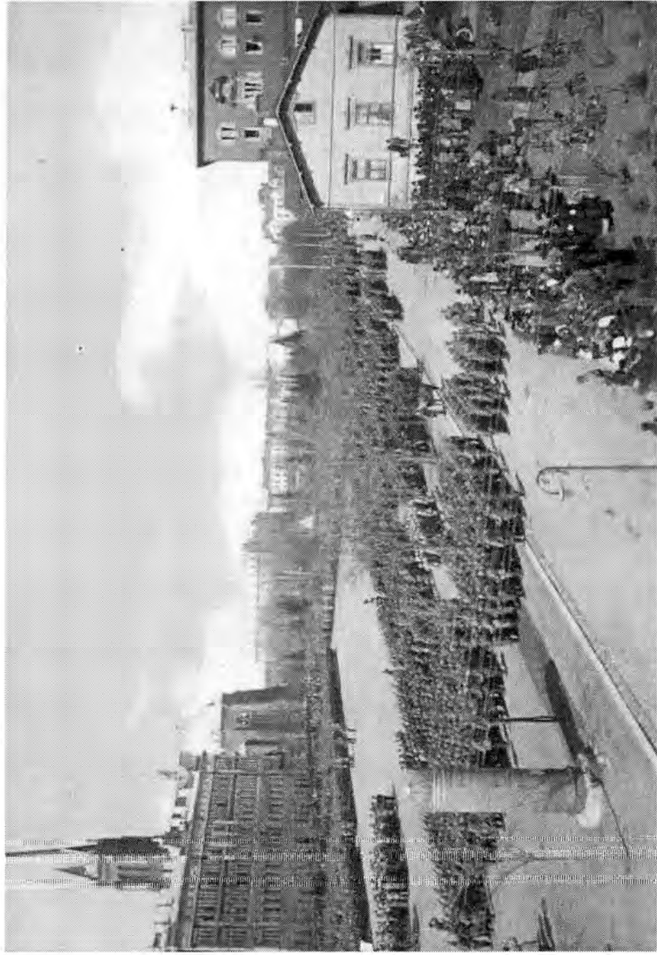
Vallottajien voittoparaati Viipurissa 1.5.1918.