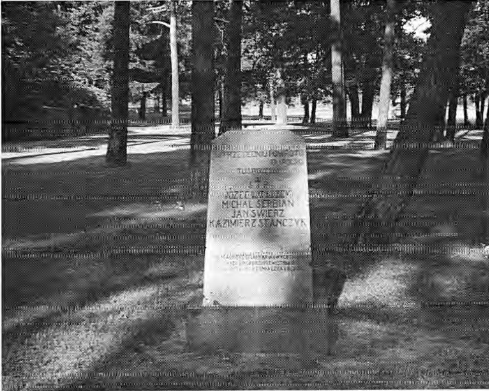
Kuvassa neljän Helsingin taisteluissa menehtyneen puolalaisen hautausmuistomerkki Tällavallan sotilashautausmaalla. Kivessä teksti: "Päivää ennen kuin olisivat palanneet Puolaan saivat sattumalta surmansa — välikohtauksessa Helsingin kaduilla 12.4.1918. Olkoon tämä vieras multa heille kepeä!