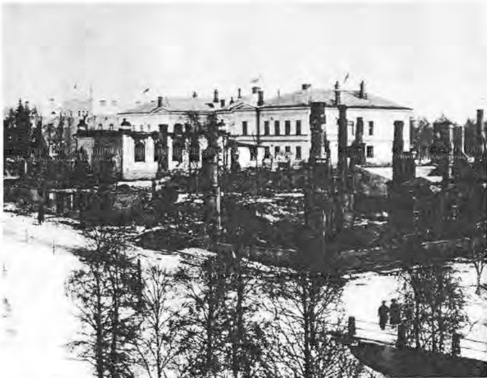
Oulun Raatissa olleita venäläisiä matruuseja syytettiin erityisesti kuvassa raunioina näkyvän puhelinkeskuksen polttamisesta.