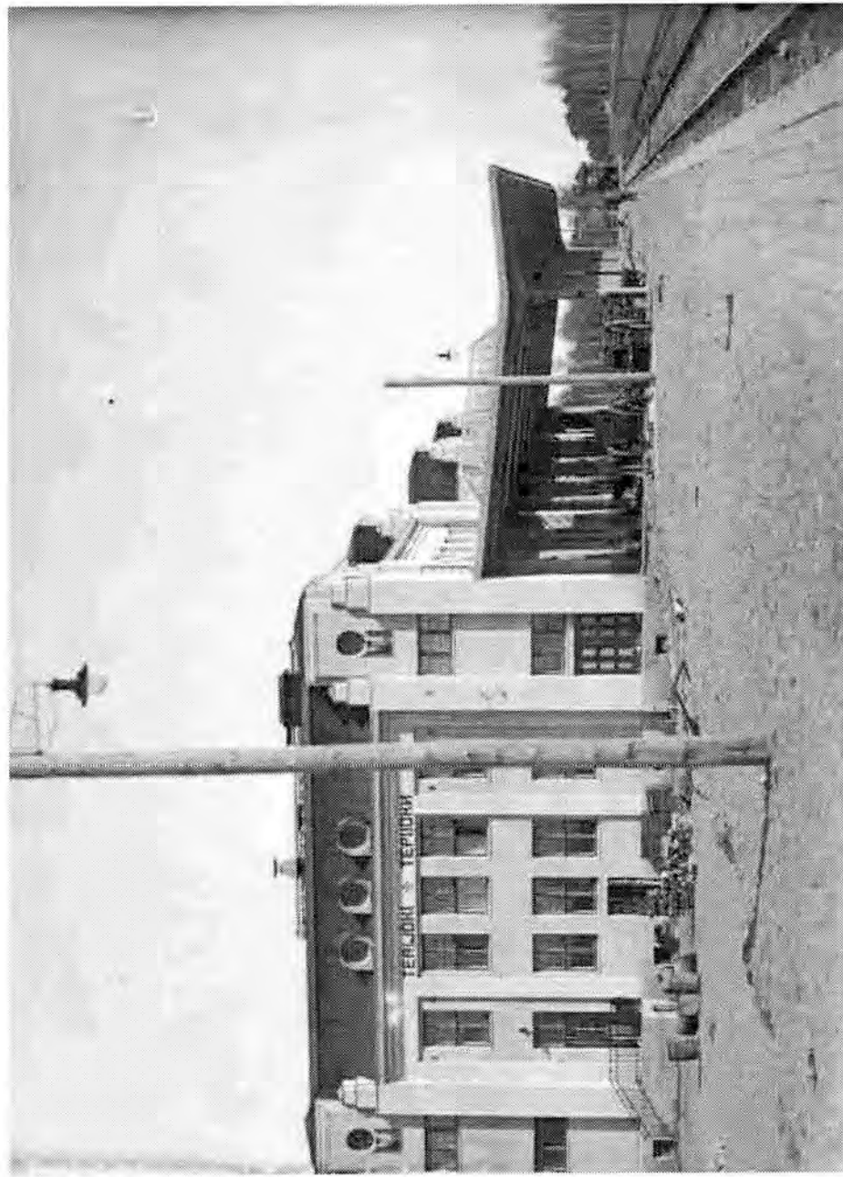
Terijoen rautatieasema valloituksen jälkeen. Kuva Sota-arkisto