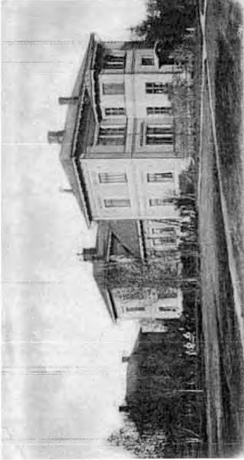
Uudenkaarlepyyn kansakoulunopettajien seminaarin päärakennus, joka keväällä 1918 palveli kaupungin venäläisen vankileirin majituspaikkana.