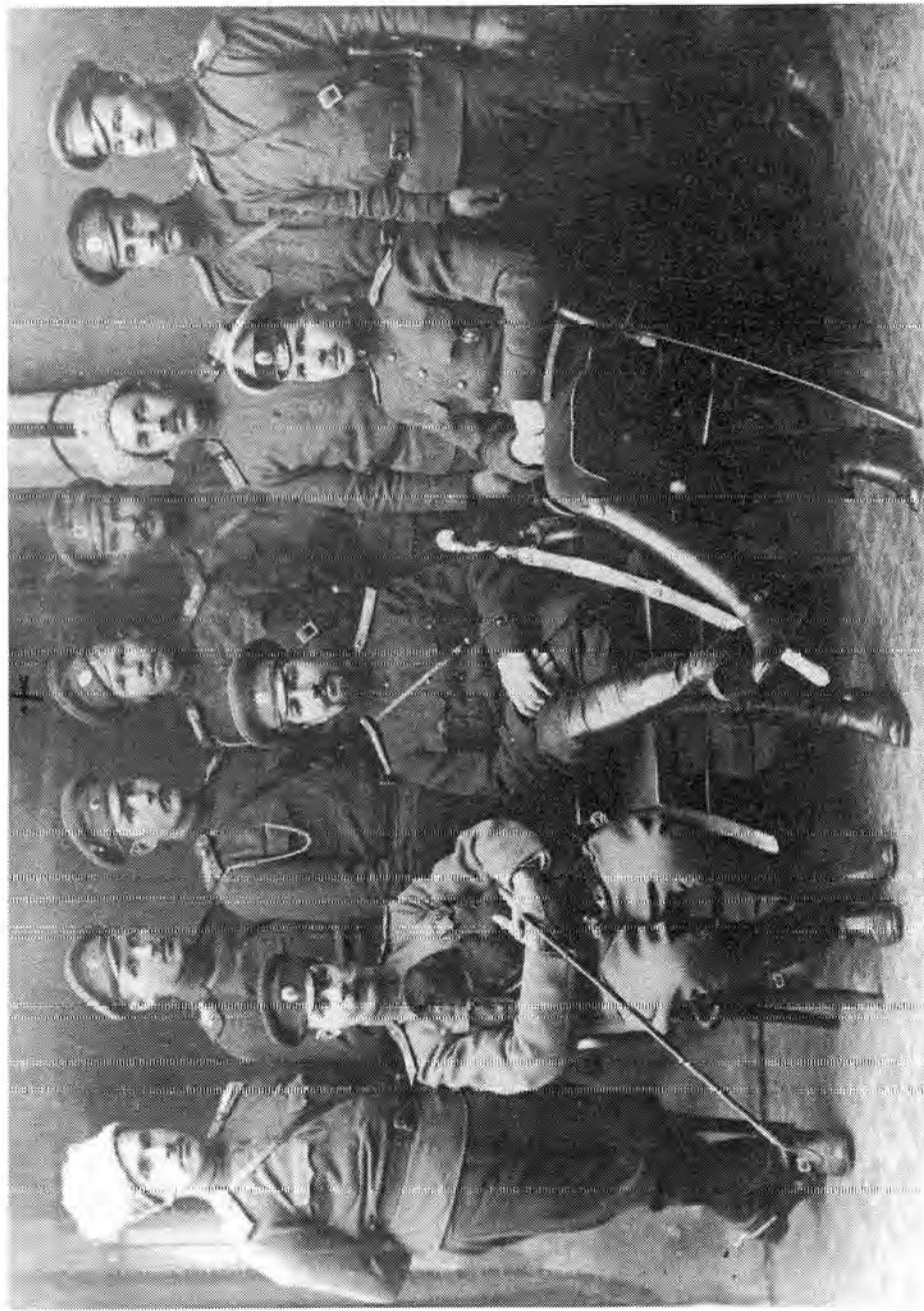
Venäjästä sotaväkeä Uudessakaarlepyyssä.