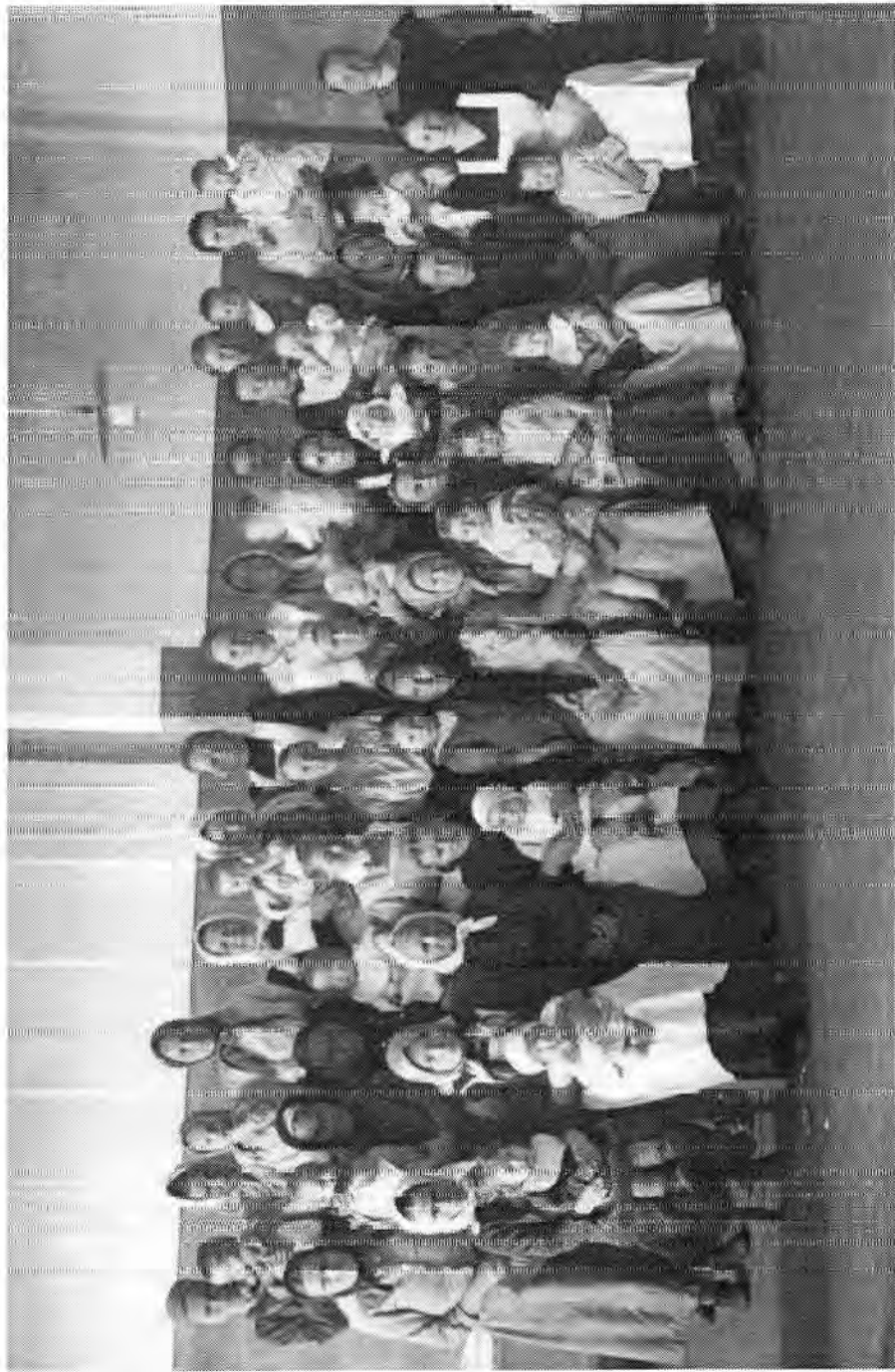
Rajan tammikuussa 1922 yltäneet karjalan naisjoukot pakolaiset suomalaisten yläpiirissä pakolaistodissa lapsireen. Kuva Orvo Bogdanovin kokoelma