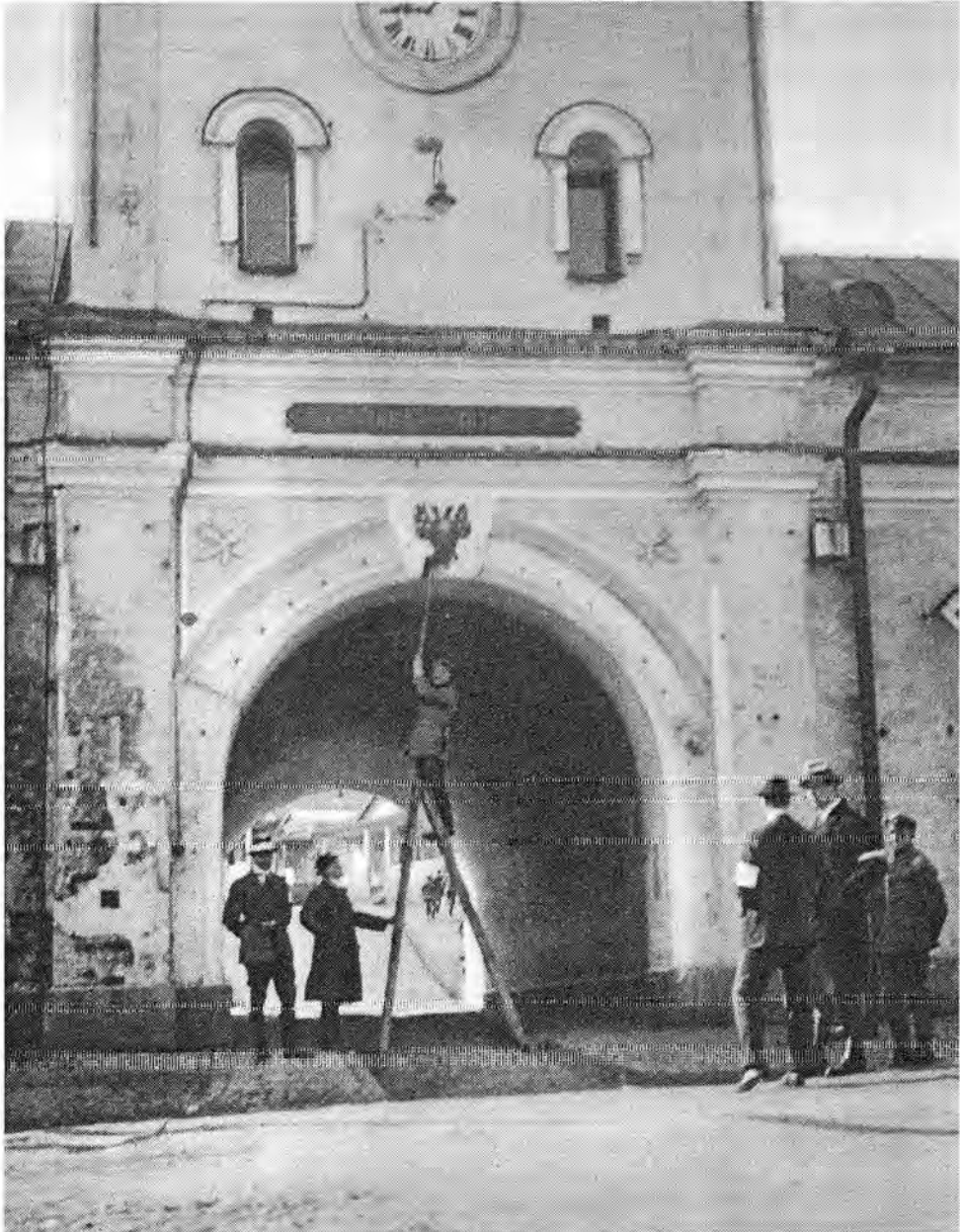
Kaksoiskotka poistetaan Viaporin portista huhtikuussa 1918.