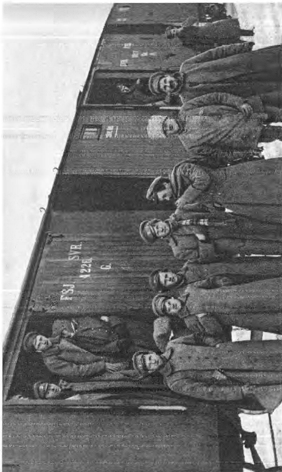
Kujetuksen lähtöä odottavia kotiutettavia venäläisvankkeja.