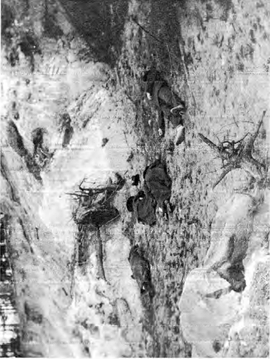
Teloituspaikka ammuttu ne naisineen ja miehineen Santa namin an hiekkakuopassa.