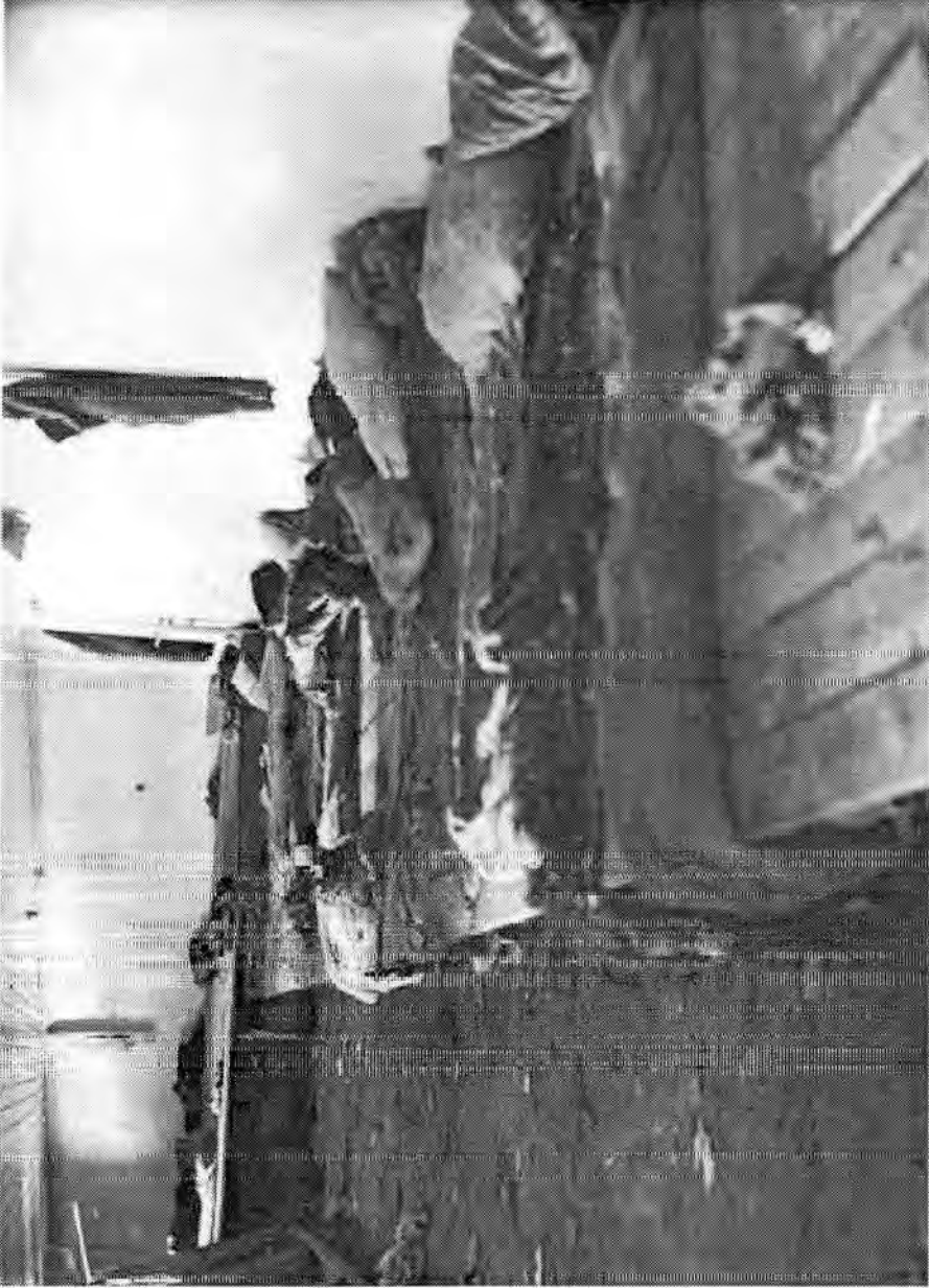
Venääläisten majoitustilat Terijoen asemalla. "Terijoen asemahuone ryssien jäljiltä" on merkitty kuvassa muistiin.