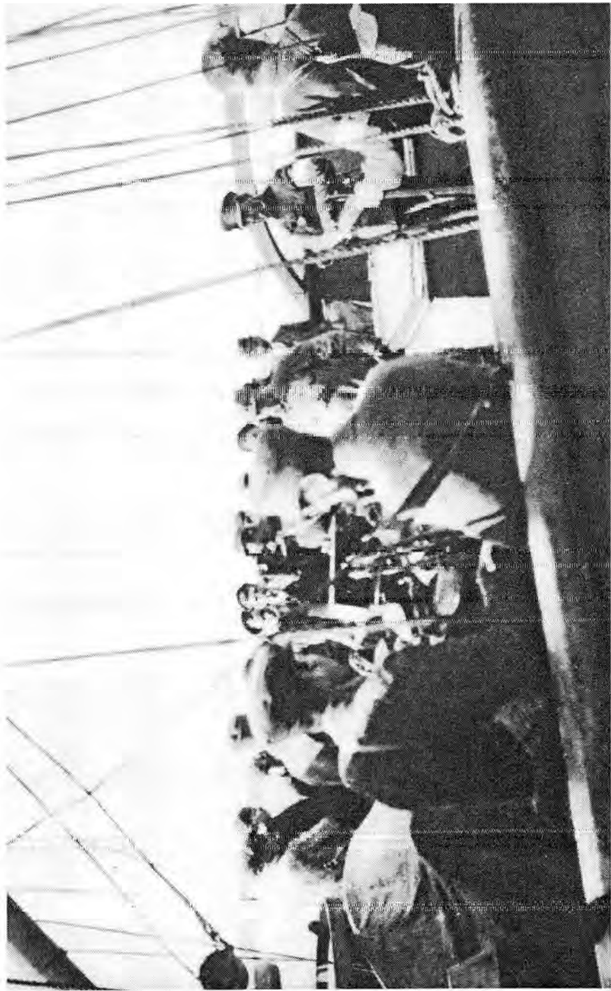
Kolme venäläistä alusta saapui Kotkaan 4.5.1918 luuller: kaupungin olevan e-Jelleen punaisten hallussa, jolloin niiden miehistö joutui suojeluskuntalaisten pidättämäksi. Kuvassa Kotkan valloittaja, majuri Alexander Pell, jakaa määrärauksiaan hämmästyneille venäläisille matruusaille.