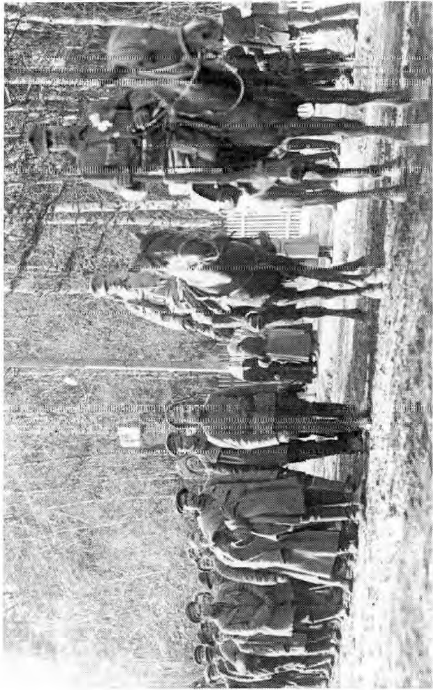
"Punarysää Terijoella" lukee tässä valokuvassa. Vuoden 1918 sodan aikana levisi uudissana "punarysää", jolla valkoiset arkoittivat venäläisten sotilaiden kanssa yhteistyössä olevia suomalaisia punakaartilaisia. Kuvassa on punaisten vankikulkue, jonka etunenään on ehkä tarkoituksellisesti asetettu yksittäinen venäläinen, jotta tämä antaisi mahdollisuuden venäläisvoittoisen leiman vankikulkueelle.