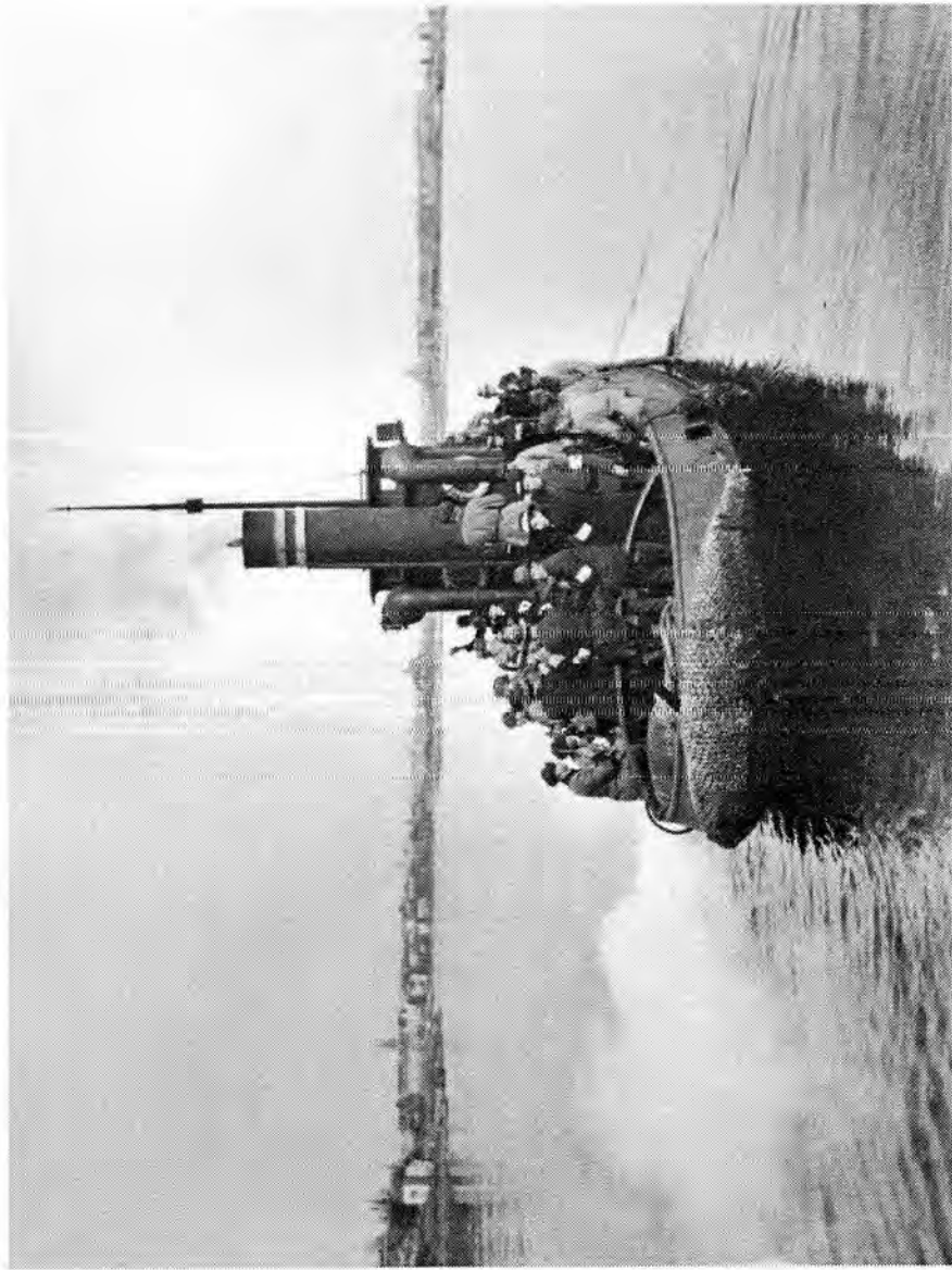
Sekä sotilaisista että suojeluskuntalaisista koostuva: teloitajat ja vartiomiehistö yhdysaluksella. Kuva on otettu Suomenlinnassa teloituksen joko meno- tai paluumatkalla. Aluksen oikealla puolella erottuu Uspenskin katedraali.