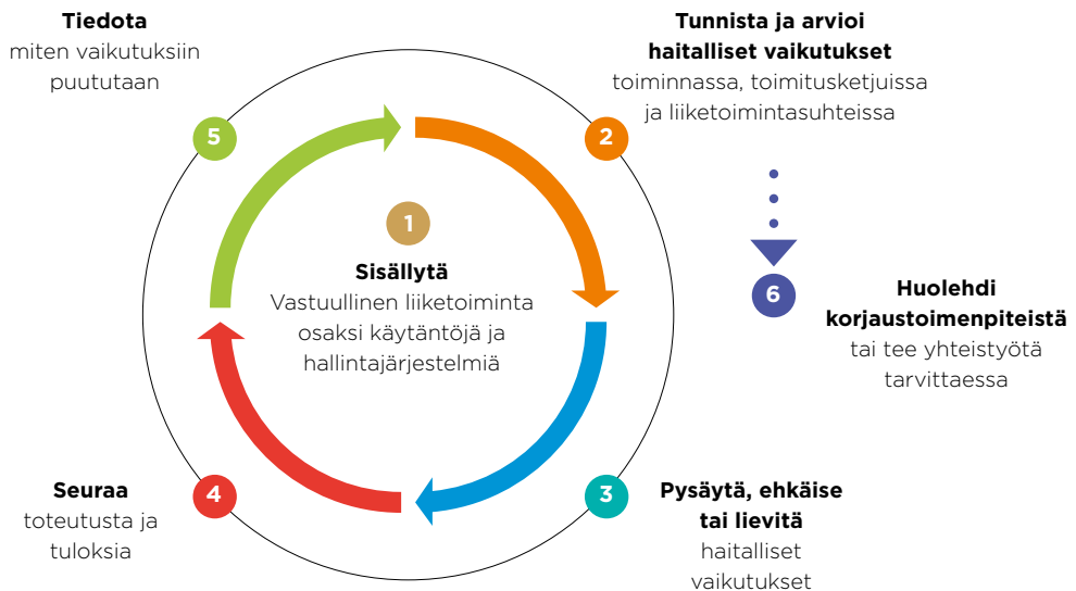
Kuva 1. Asianmukaisen huolellisuuden prosessi ja sitä tukevat toimenpiteet

Tässä kuvailtuja käytännön toimenpiteitä ei ole tarkoitettu tyhjentäväksi listaksi, jota tulee noudattaa orjallisesti. Kaikki käytännön toimenpiteet eivät sovellu jokaiseen tilanteeseen. Joissakin tilanteissa voi olla hyödyllistä suorittaa muita toimenpiteitä, jotka eivät sisälly näihin ohjeisiin.