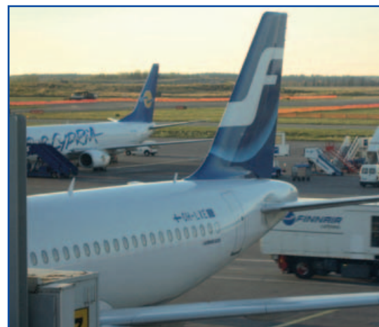
Lentoliikennemarkkinoiden pelisäännöt kaipaavat komission mielestä viilausta.

Asiaa on alettu käsitellä neuvoston työryhmässä. Suomessa liikenne- ja viestintäministeriö on kutsunut lentoliikennealan edustajat ja muut intressiryhmät 10. marraskuuta pidettävään kuulemistilaisuuteen. (MN)