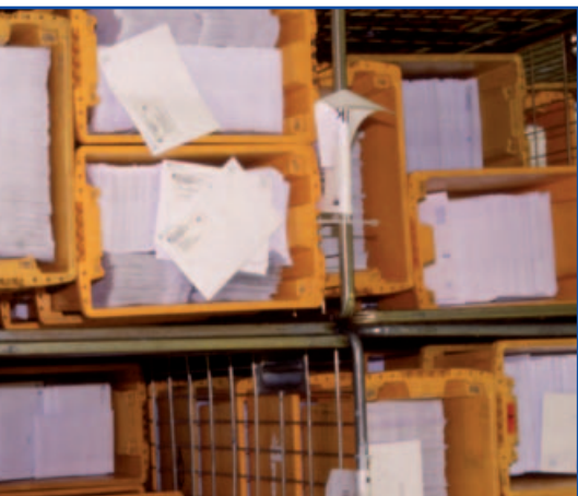
kantoja jakava prosessi.

uudistusehdotus tämän vuoden loppuun mennessä. Jäsenmaiden tulisi saattaa uuden direktiivin mukaiset säännökset voimaan vuoden 2009 alkuun mennessä.