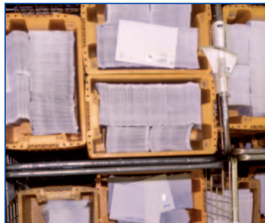
Postipalveluiden avaaminen on ollut jäsenmaiden

◆ Komissio julkaisi ehdotuksensa uudeksi postidirektiiviksi 18. lokakuuta. Ehdotuksella halutaan avata postipalvelut täydellisesti kilpailulle kaikkialla EU:ssa. Ehdotus vahvistaa jo aiemmin sovitun tavoitteen, että vuoden 2009 alusta lähtien mitään postipalvelua ei saisi varata minkään yrityksen erityisoikeudeksi.