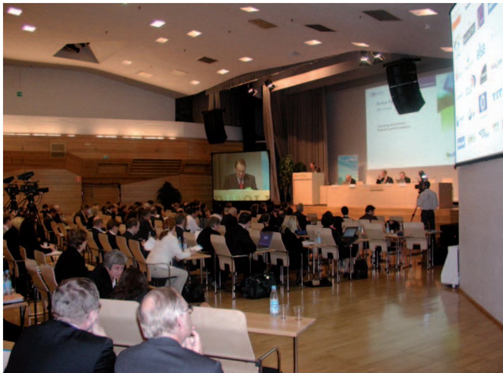
Euroopan parlamentin jäsen Reino Paasilinna puhui konferenssiyleisölle tietoyhteiskunnan ja hyvinvointiyhteiskunnan suhteesta.

Kokouksen yksi päätehtävä oli valmistella raportointia Eurooppa-neuvostolle