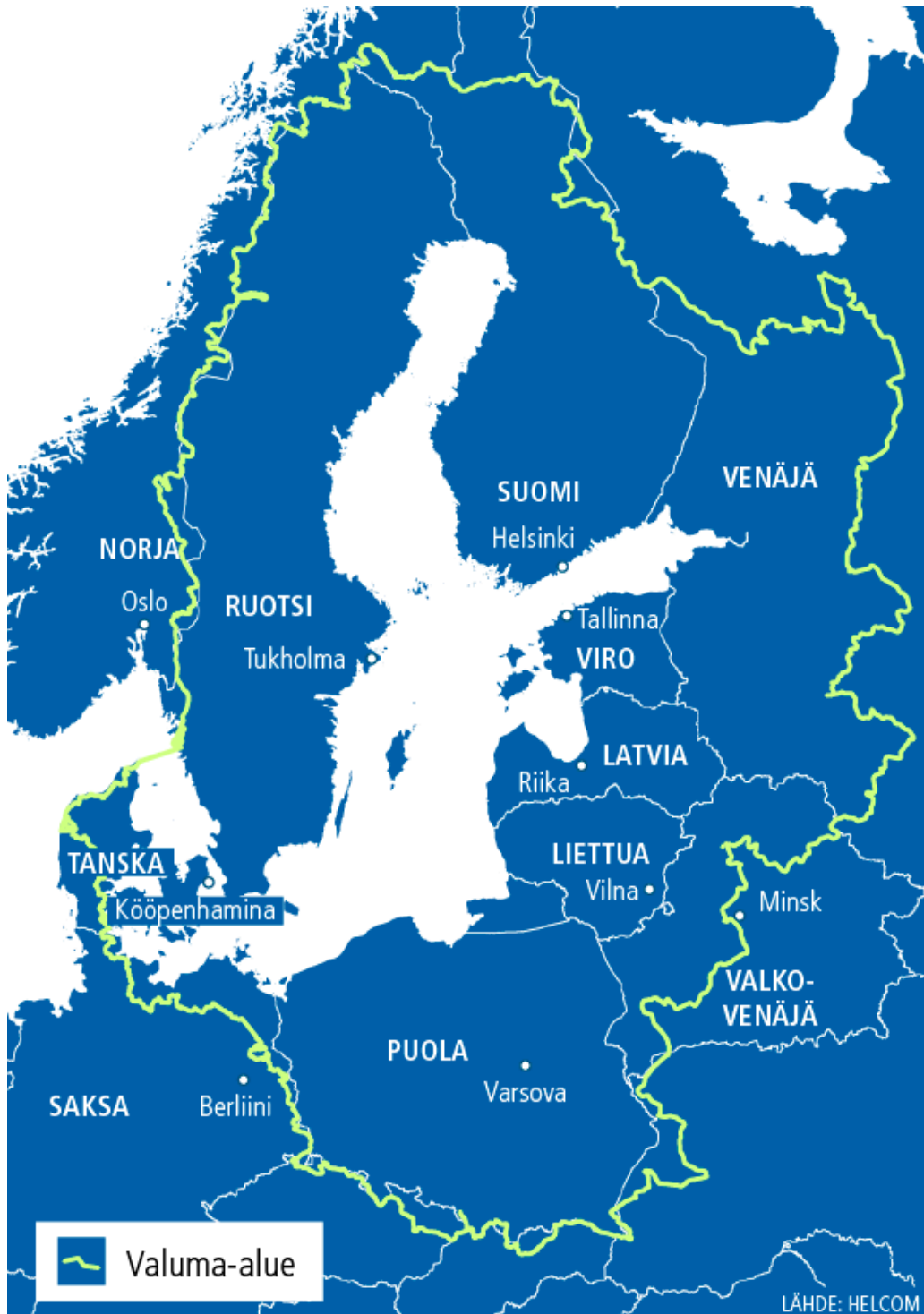
Kuva 1. Itämeren valuma-alue.