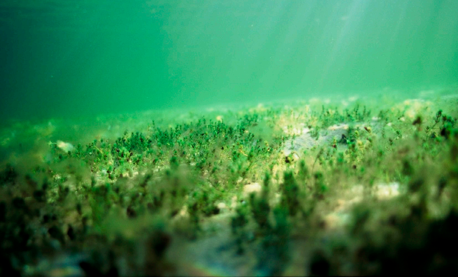
Itämeren vedenalaista luontoa.