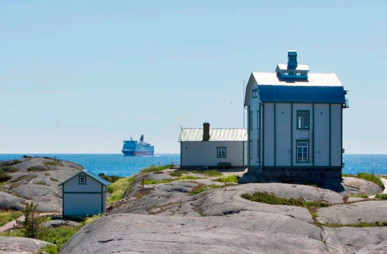
Ahvenanmaan saaristoa.