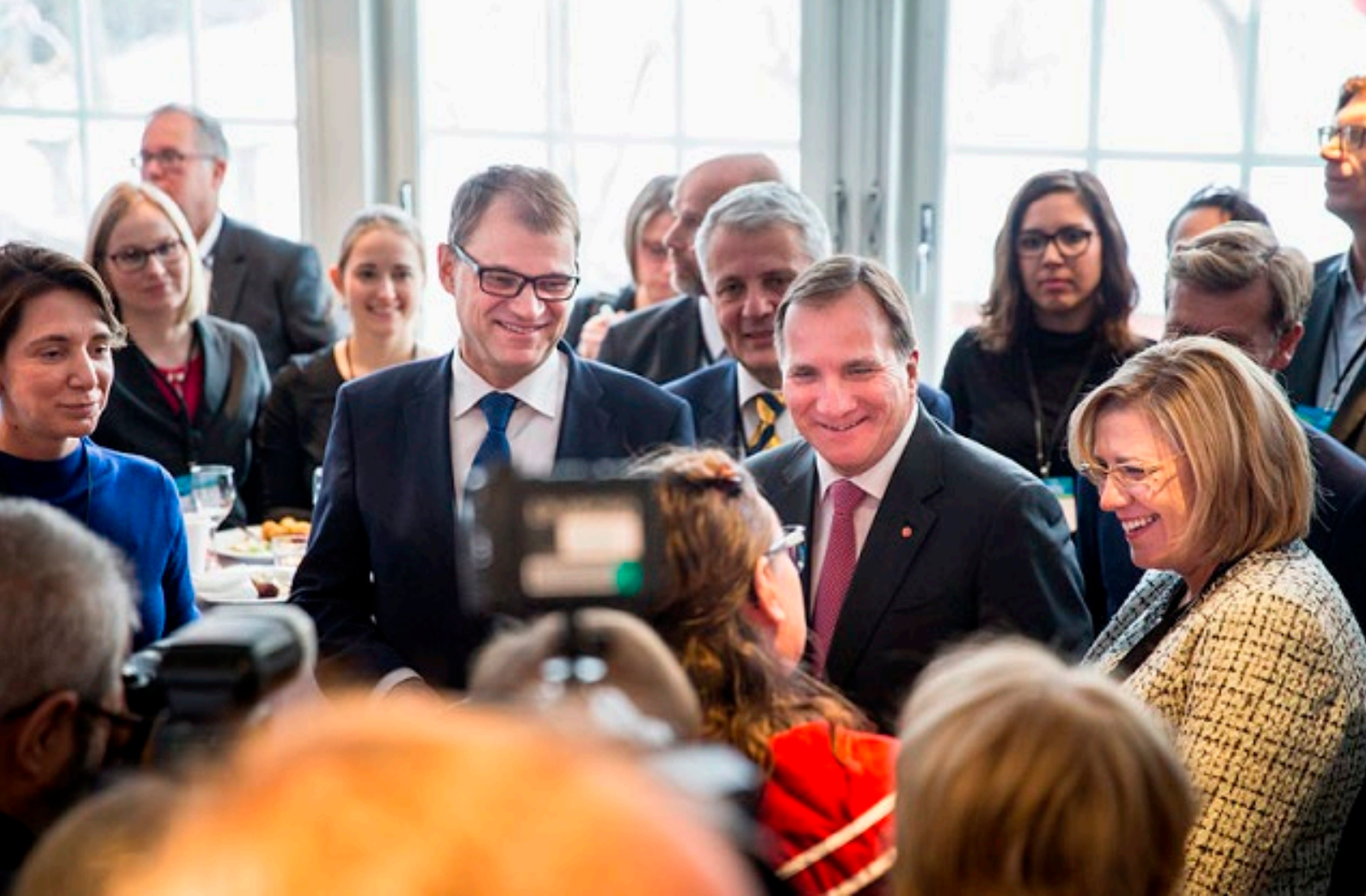
Pääministerit Juha Sipilä ja Stefan Löfven EU:n Itämeri-strategian vuosifoorumissa Tukholmassa 2016.