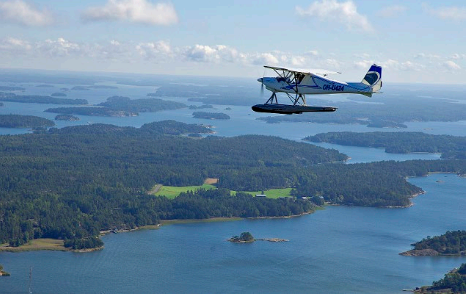
Lentäen Nauvon saaristossa.