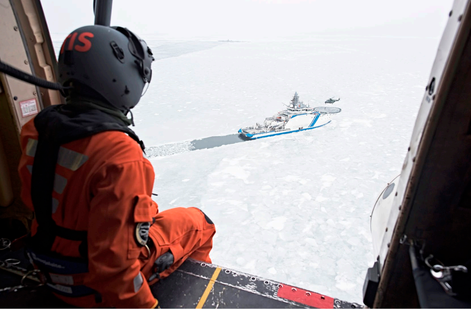
Vartiolaiva Turva.

elämään. Toimintamallin mukaisesti Suomi käyttää tarvittaessa yhteiskunnan elintärkeiden toimintojen turvaamiseen ja ylläpitämiseen koko yhteiskunnan voimavaroja sekä normaaliaikoina että poikkeusoloissa. Itämeren alueen turvallisuudella on tärkeä merkitys yhteiskunnan elintärkeiden toimintojen ja ihmisten arjen toimivuudessa. Kokonaisturvallisuuden toimintamalli luo hyvät edellytykset vastata Itämeren alueen laaja-alaisiin turvallisuusuhkiin.