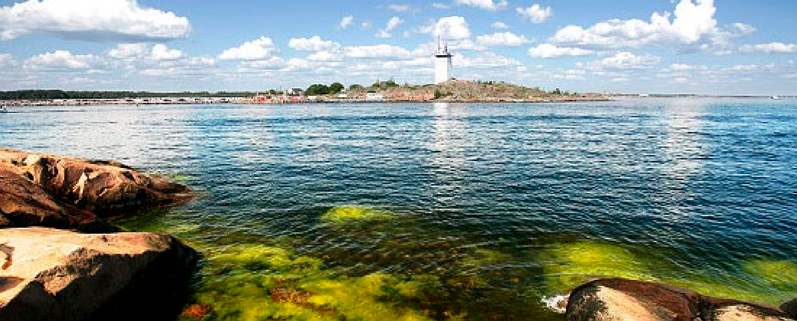
Itämeren rantoja.

ketteriä uuden teknologian käyttöönotossa. Itämeren ympärillä sijaitsee kolmannes EU:n johtavista innovaatioalueista . Itämeren maat ovat menestyneet huomattavan hyvin EU:n Horisontti 2020 -ohjelman ja LIFE IP:n tutkimus-, kehittämis- ja innovaatiohankkeiden (TKI) rahoituksen hankkimisessa.