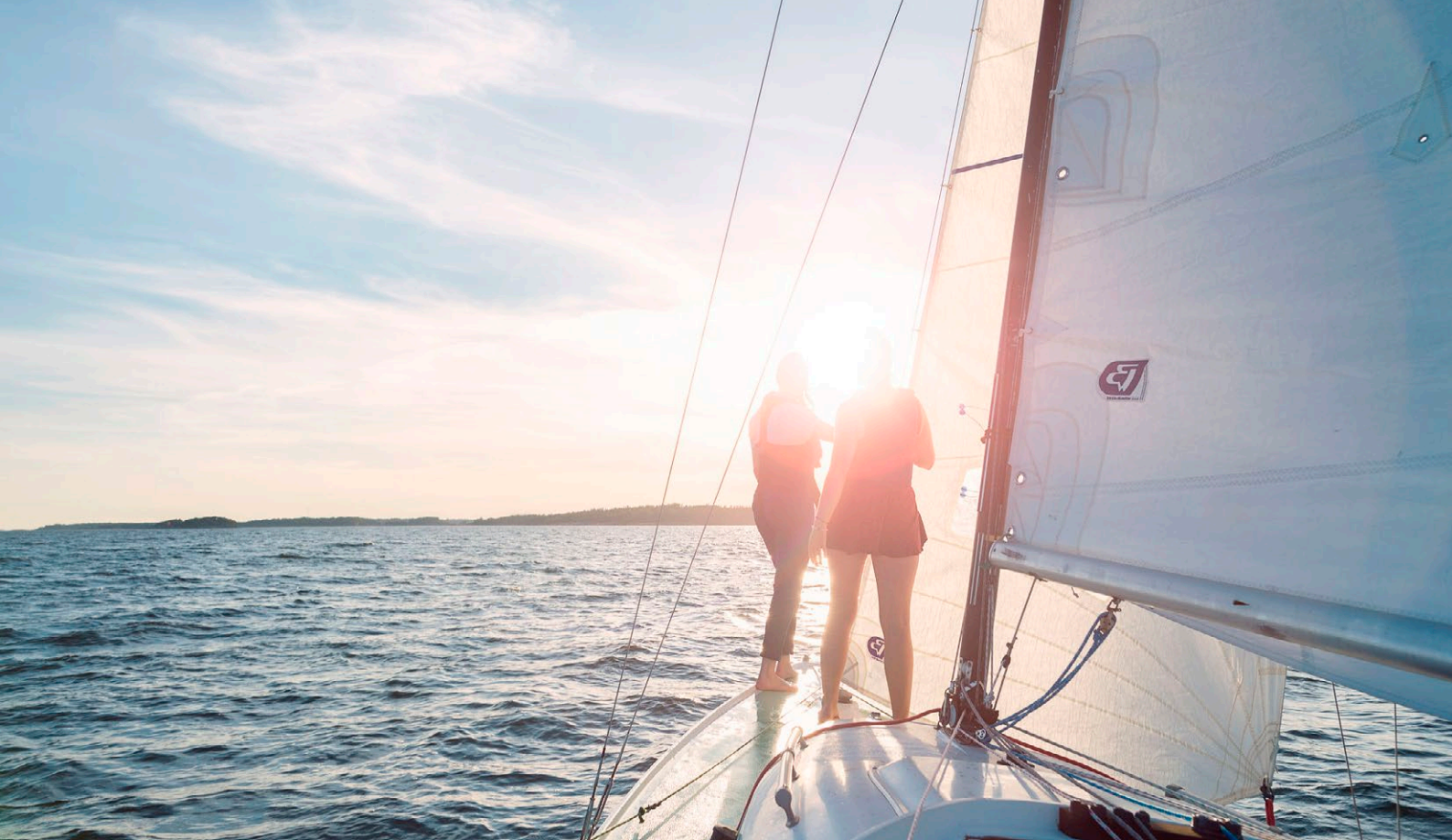
Det finns mycket potential i Östersjöturismen.

särdrag med hänsyn till bevarandet av undervattenskulturarvet och ett hållbart utnyttjande i turismsyfte