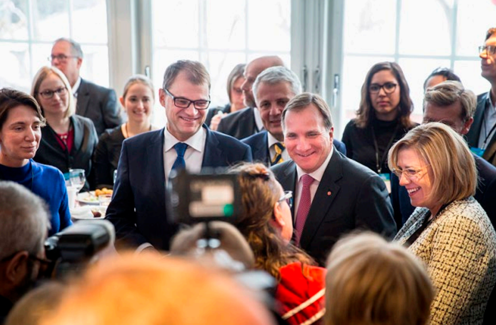
Statsministrarna Juha Sipilä och Stefan Löfven på Strategiforumet för EU:s Östersjöstrategi, Stockholm 2016.

Målen för EU:s Östersjöstrategi – att rädda havet, förena området och utöka välfärden – är riktiga också framöver. Även om det har gjorts framsteg på många områden, finns det fortfarande problem att lösa.