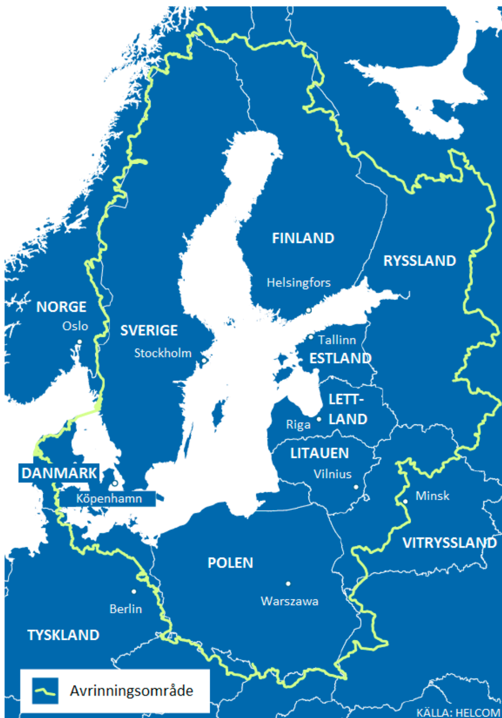
Figur 1. Östersjöns avrinningsområde.