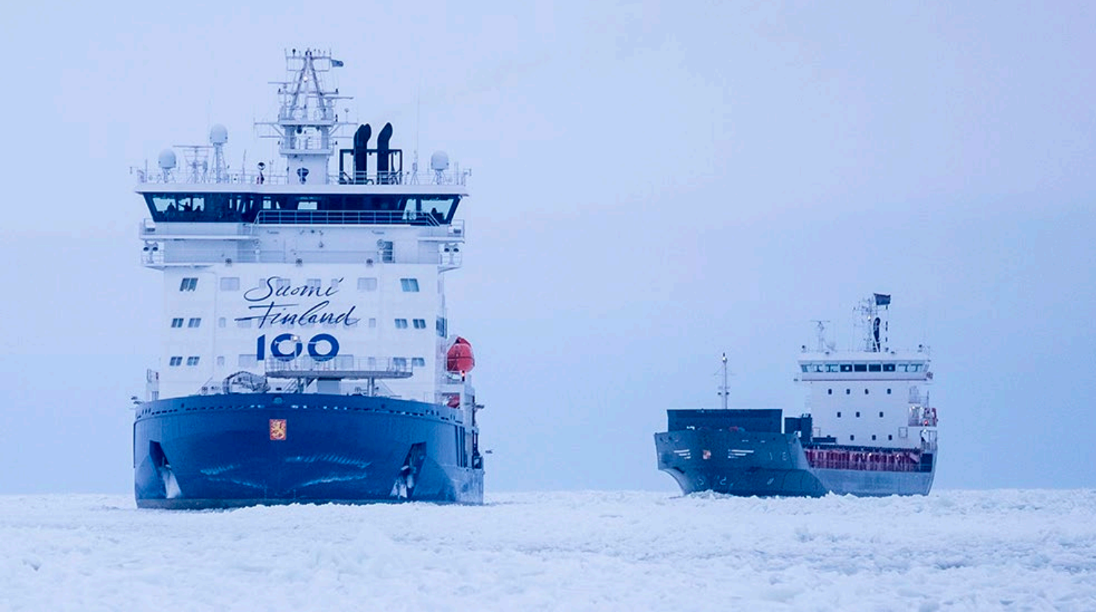
Polaris, världens första isbrytare som kan drivas med både diesel och flytande naturgas (LNG).