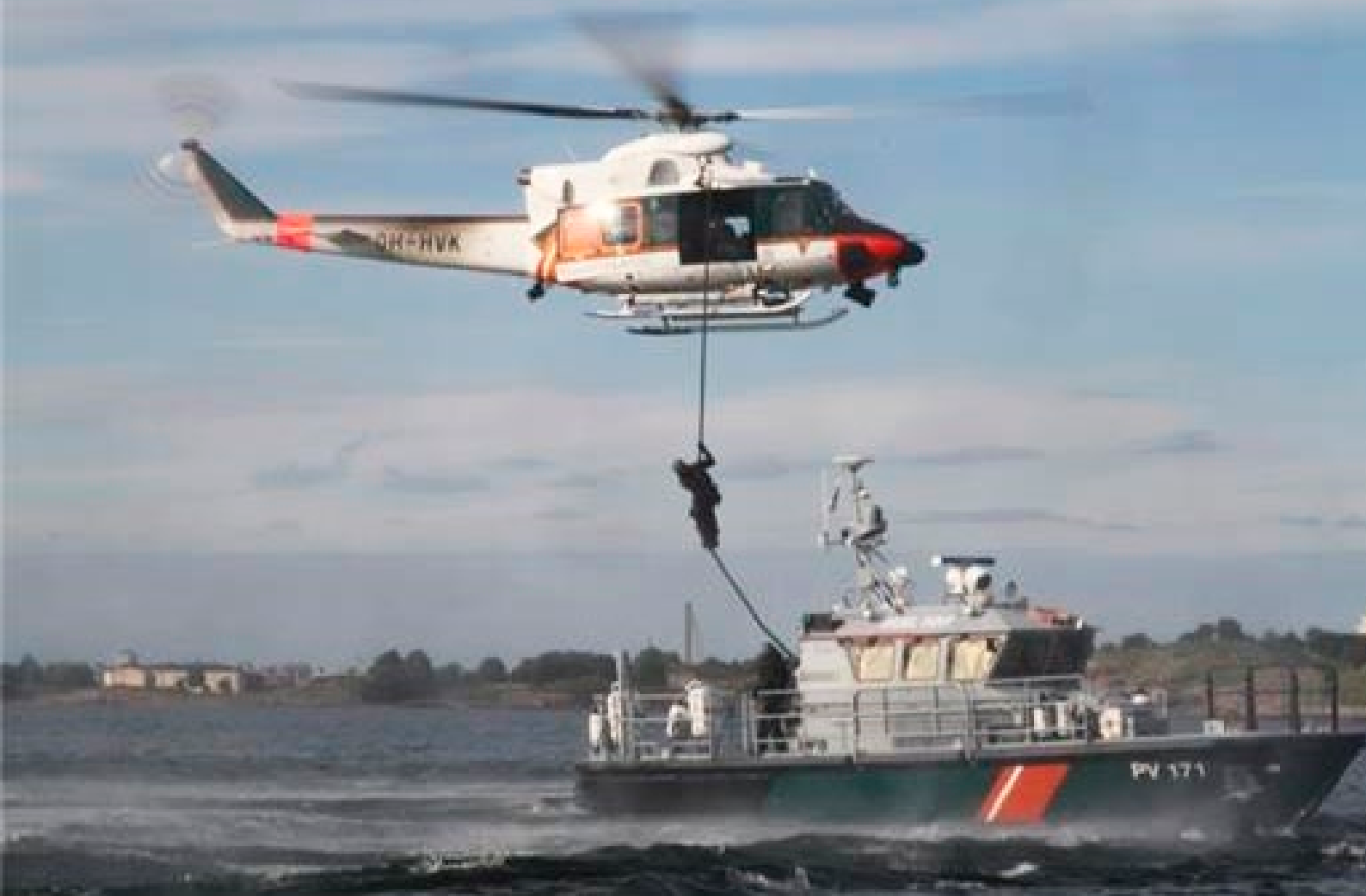
Finska vikens sjöbevakningssektion på fältet.

av den marina miljön. Verksamheten för samman Östersjöns EU-stater, EU och Ryssland till samma bord. HELCOM ger skyddet av Östersjön politiska riktlinjer. De viktigaste målen i HELCOM:s handlingsprogram för skydd av Östersjön (2017, 2013) är att dämpa eutrofieringen, minska belastningen från skadliga ämnen, förbättra status för naturens mångfald och miljöskyddet i sjöfarten. Genom handlingsprogrammet är Östersjön det enda marina området i världen som har ett internationellt avtalat tak för utsläpp av näringsbelastning och ett mellan staterna fördelat mål för minskning av utsläpp. År 2017 hade ca 60 % av åtgärderna i handlingsprogrammet genomförts och HELCOM beslutade att börja uppdatera programmet.