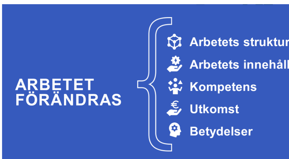
Bild 1. Arbetets förändringar

I detta kapitel lyfter vi upp fem teman och frågor i anslutning till förändringsgången för arbetet som det vore viktigt att finna svar och lösningar på i den nära framtiden.