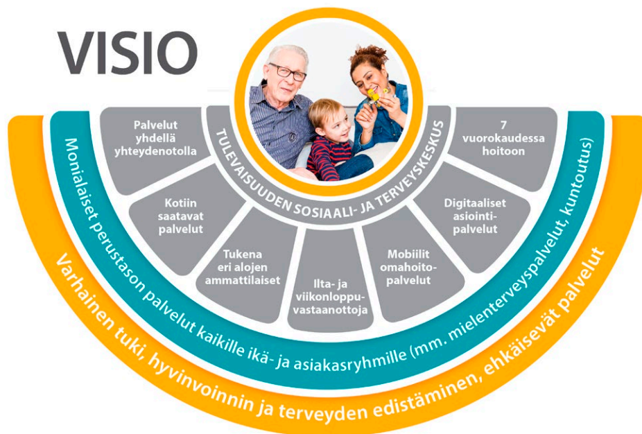
Kuva 1. Visio laaja-alaisesta sosiaali- ja terveyskeskuksesta

Sosiaali- ja terveyskeskuksen asiakaskunta ei ole yhtenäinen joukko. Sen vuoksi kehittämistyötä tulee tarkastella kokonaisuutena ja tunnistaa eri asiakasryhmien voimavaroja ja tukea antavia verkostoja, mutta myös ongelmien moninaisuutta. Keskeisten asiakassegmenttien tunnistamisen ja niiden pohjalta rakennettujen eri asiakasryhmien palvelukokonaisuuksien ja palveluketjujen kautta voidaan eriyttää erilaisia vaikuttavia palveluja asiakkaiden tarpeiden ja voimavarojen mukaan. Näin voidaan suunnata resursseja asiakastarpeen mukaisesti uudella tavalla. Tulevaisuuden sosiaali- ja terveyskeskus tarvitsee myös kansalaisyhteiskunnan yhteisöjä ja järjestöjä kumppanikseen rakentamaan asukkaiden ja asiakkaiden hyvinvointia. Joillain alueilla toiminnassa hyvinvointikeskuksia, joissa on jo paljon tulevaisuuden sosiaali- ja terveyskeskuksen elementtejä.