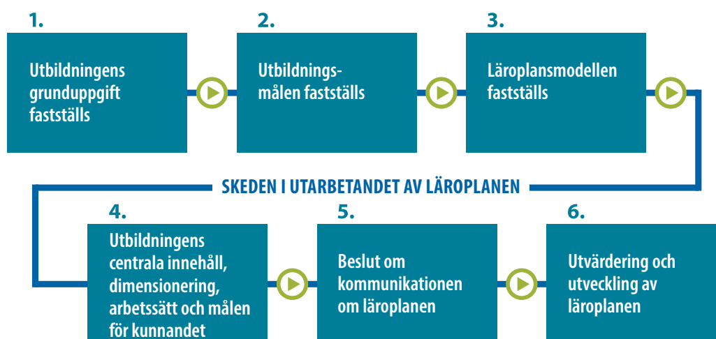
Bild 1. Processchema över skedena i läroplansarbetet (Maria Miettinen, Statsrådets kansli 2019))