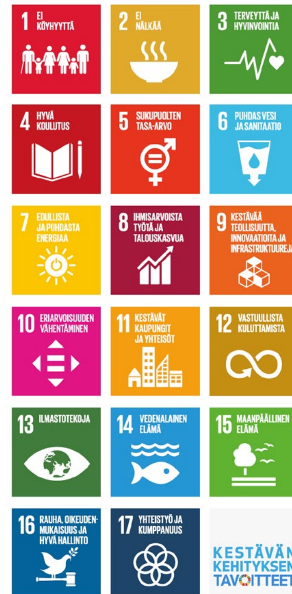
KUVA 1. Agenda 2030 -tavoitteet.