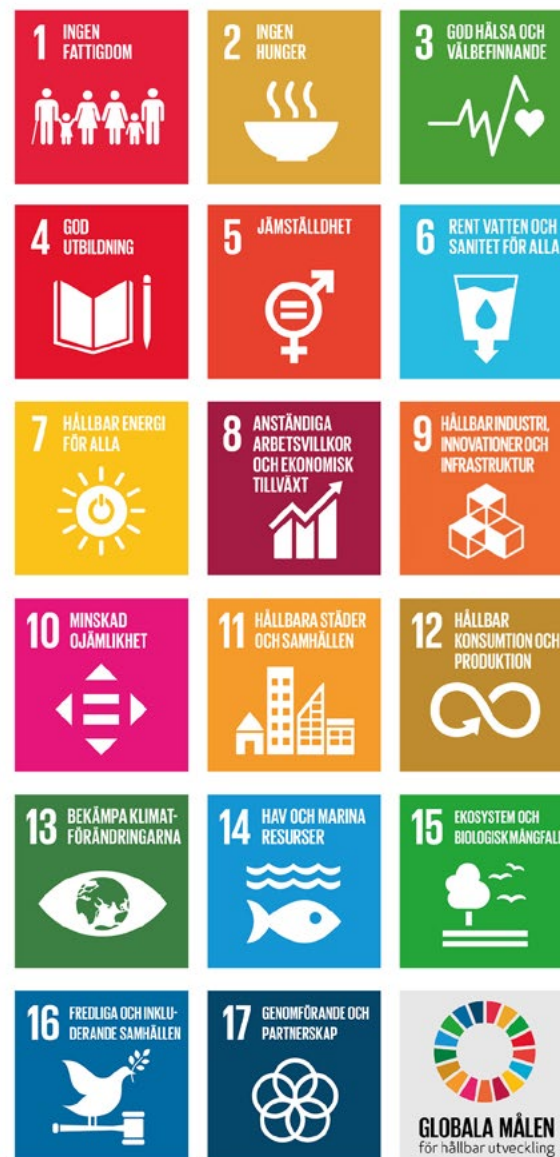
BILD 1. Målen för Agenda 2030.