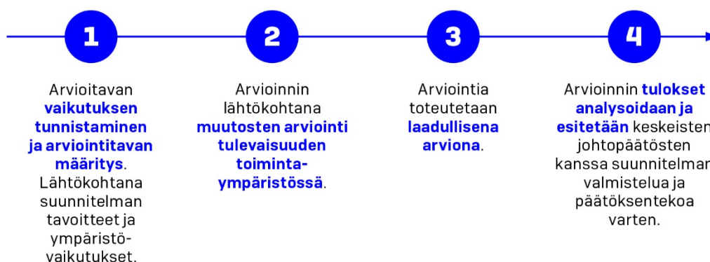
Kuva 4. Vaikutusten arvioinnin eteneminen.

Arvioinnin valmisteluvaiheet on esitetty pääpiirteissään kuvassa 4. Vaikutusten arviointia raamittaa arviointikehikko, johon on kuvattu arvioitavat vaikutusalueet. Vaikutusalueet on kytketty suunnitelmalle asetettuihin tavoitteisiin (liite 2), mikä tehnyt tavoitteiden toteutumisen arvioinnista systemaattista ja läpinäkyvää.