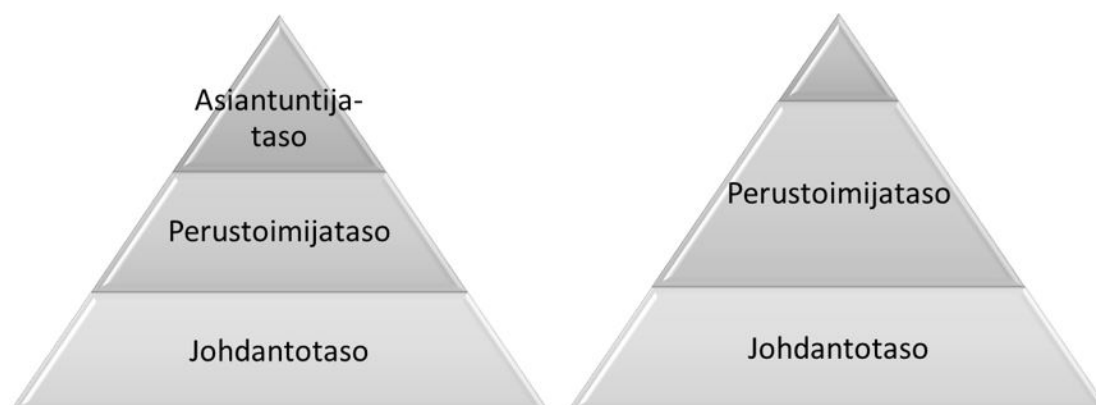
Kuva 3. Kansainvälisen avun vastaanottamisen toimintamallin pelastustoimen henkilöstön ja muiden toimijoiden koulutuspolut pyramidimallina. (Pulli, HNS- koulutuspolut 2021)