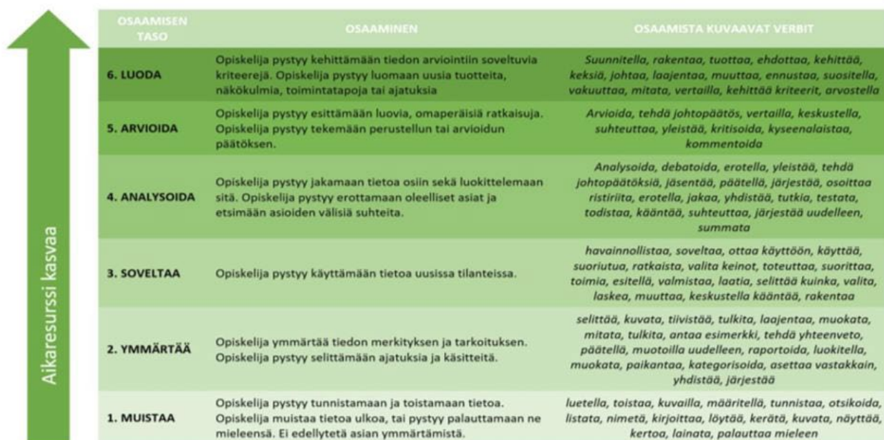
Taulukko 2. Bloomin uudistettu taksonomia taulukkomuodossa. (Valanne 2017)