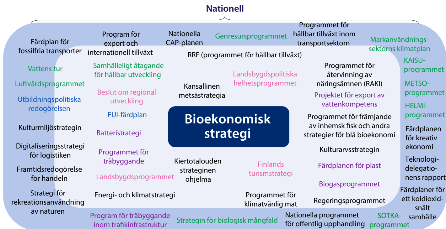
Bild 2. Bioekonomin har kontaktytor till ett betydande antal andra nationella strategier och program.

I uppföljningen av den bioekonomiska strategin beaktas beredningen och uppdateringen av dessa nationella och internationella strategier och program.