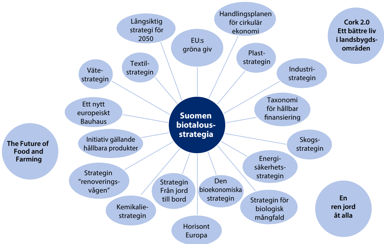
Bild 3. En EU-granskning av Finlands bioekonomiska strategi, främst i förhållande till unionens bioekonomiska strategi, men även till en lång rad andra strategier, program och finansieringsinstrument.