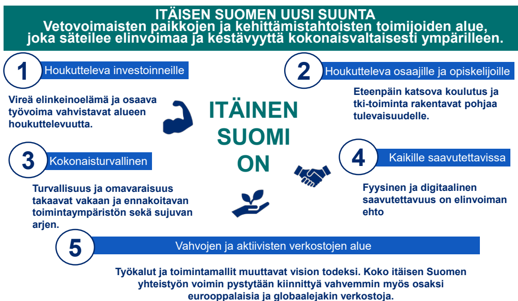
Kuvio 1. Itäisen Suomen vision teemat ja ydinajatuksat.