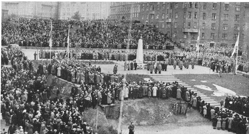
Avtäckningen av Ässä-regementets hjältestaty i Alli Tryggs park blev en minnesvärd fest som följdes av en publik på omkring tjugotusen personer.

Detta exempel från traditionsarbetets begynnelseår som visar avtäckningen av Ässä-regementets minnesmärke 1940 ger tillsammans med det tal som hölls när grundandet av Traditionsförbundet Eklövet offentliggjordes den 24 april 2003 i Helsingfors en god beskrivning av traditionsarbetets utveckling från 1940-talet till 2000-talet.