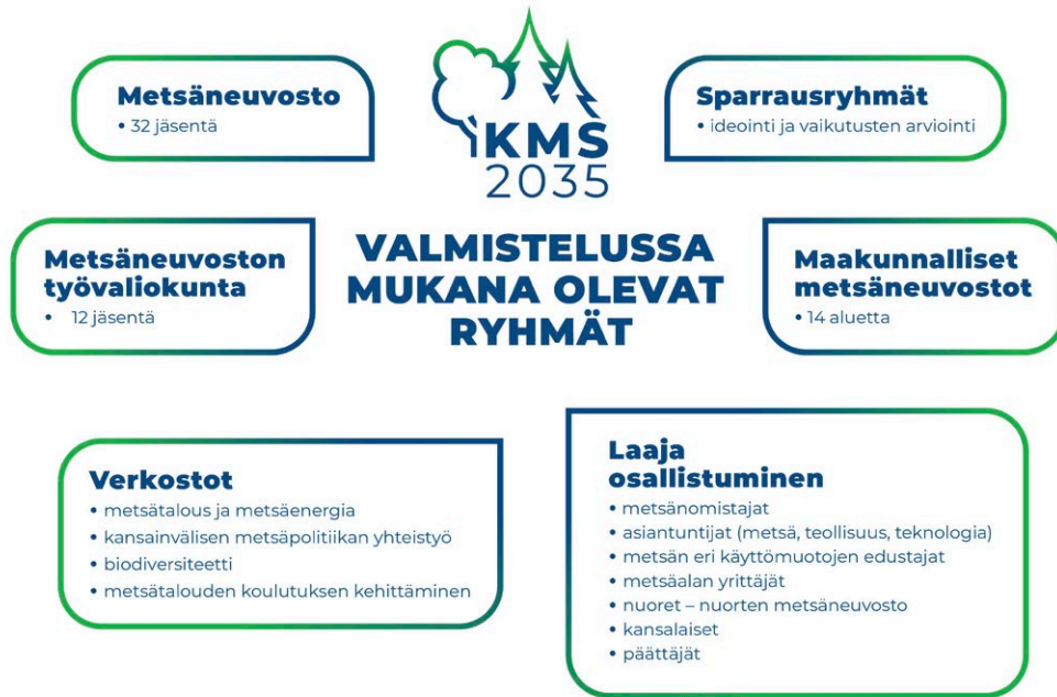
Kuvio 1. Metsästrategian valmisteluun osallistuneet ryhmät.

Kansallinen metsästrategia on yhteensovittava elinkeinostrategia, jossa otetaan huomioon niin ihminen, ympäristö kuin talous. Se kattaa metsätalouden ja -teollisuuden lisäksi myös metsien muihin sekä aineellisiin että aineettomiin tuotteisiin perustuvan tuotannon, jalostuksen, palvelut ja julkishyödykkeet sekä metsäalan osaamis- ja koulutuskysymykset. Strategialla on liittymäkohtia useisiin kansainvälisiin ja kansallisiin strategioihin ja ohjelmiin. Kansainväliset sekä EU:n metsä-, energia- ja ympäristöpoliittiset sitoumukset ja sopimukset vaikuttavat merkittävästi Suomen metsäsektoriin. Yhdistyneiden kansakuntien (YK) prosesseissa muotoutuu, millaisen roolin metsät maailmanlaajuisesti saavat tulevaisuuden haasteiden ratkonnassa. Suomi on sitoutunut ekologisesti, taloudellisesti ja sosiaalisesti kestävään kehitykseen (Agenda 2030 -toimintaohjelma).