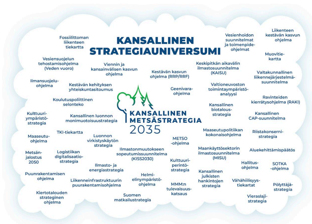
Kuvio 3. Kansalliseen metsästrategiaan linkittyviä kansallisia strategioita ja ohjelmia.