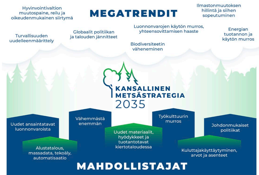
Kuvio 2. Metsäalaan vaikuttavia megatrendejä ja mahdollistajia (Lähde Luonnonvarakeskus 61/2022).