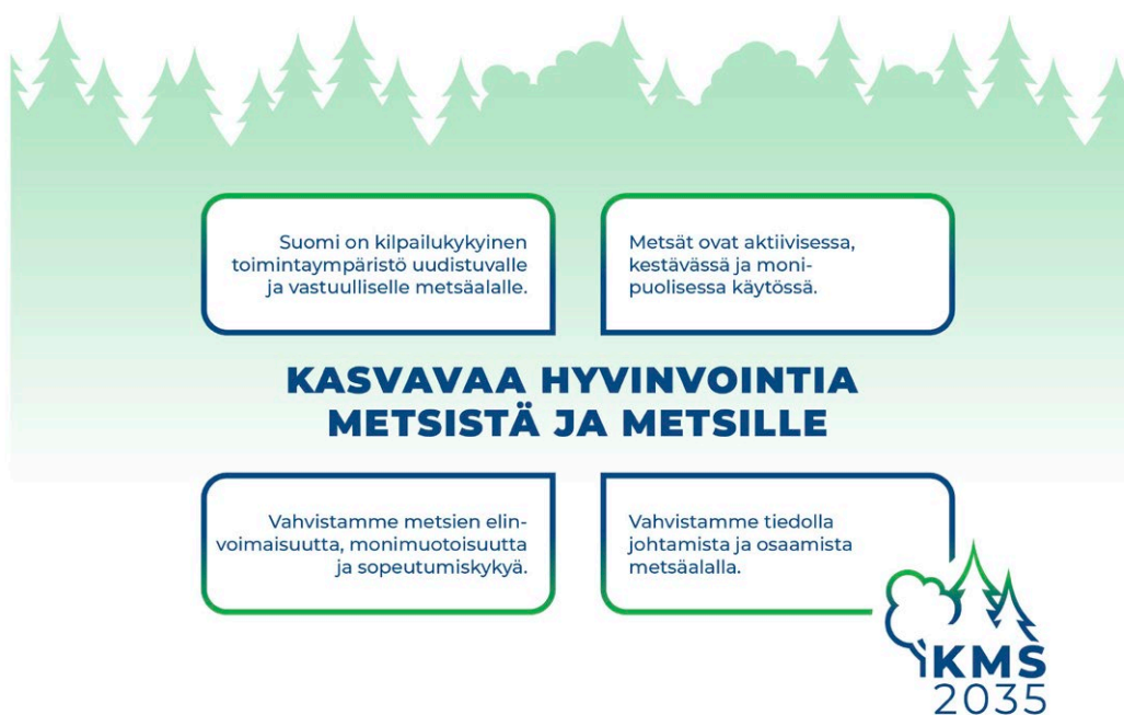
Kuvio 4. Metsästrategian visio ja päämäärät.