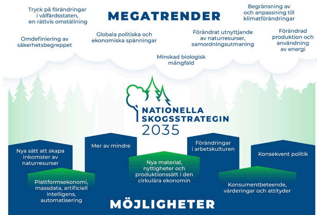
Figur 2. Megatrender och möjliggörare som påverkar skogsbranschen (Källa Naturresursinstitutet 61/2022).

Det är svårt, men ändå nödvändigt att identifiera och förutse förändringsfaktorer (figur 2). För att utvecklingsåtgärderna ska bli verkningsfulla krävs det att man systematiskt strävar efter att identifiera osäkerheter och risker i anslutning till skogsbranschen samt deras effekter.