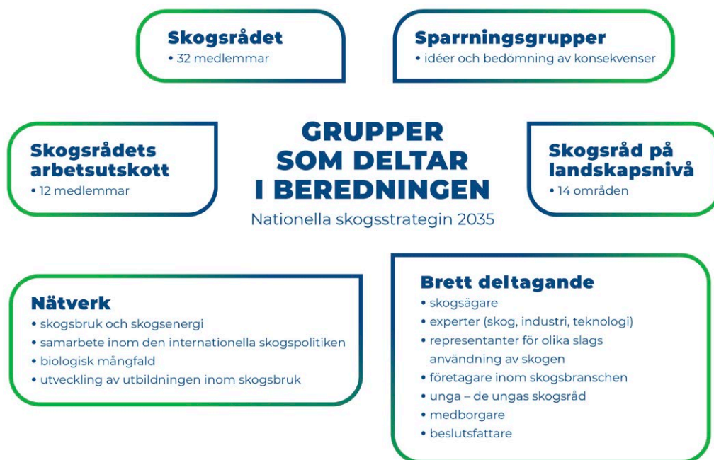
Figur 1. Grupper som deltagit i beredningen av skogsstrategin.

Den nationella skogsstrategin är en samordnande näringsstrategi som beaktar såväl människan och miljön som ekonomin. Den omfattar inte bara skogsbruket och -industrin, utan även produktion, förädling, tjänster och offentliga nyttigheter som baserar sig på andra materiella och immateriella produkter från skogarna samt kompetens- och utbildningsfrågor inom skogsbranschen. Strategin har beröringspunkter med flera internationella och nationella strategier och program. Skogs-, energi- och miljöpolitiska åtaganden och avtal på såväl internationell som EU-nivå har en betydande inverkan på Finlands skogssektor. I Förenta nationernas (FN) processer utformas rollen som skogarna får globalt för att lösa framtida utmaningar. Finland har förbundit sig till en ekologiskt, ekonomiskt och socialt hållbar utveckling (verksamhetsprogrammet Agenda 2030).