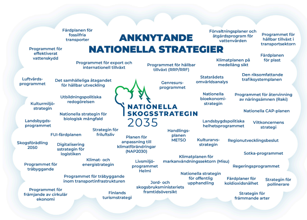
Figur 3. Nationella strategier och program med anknytning till den nationella skogsstrategin.

den nationella planen för anpassning till klimatförändringen (KISS2030). METSO- och Helmi-programmen kompletterar den nationella skogsstrategin i målen för ekologisk hållbarhet.