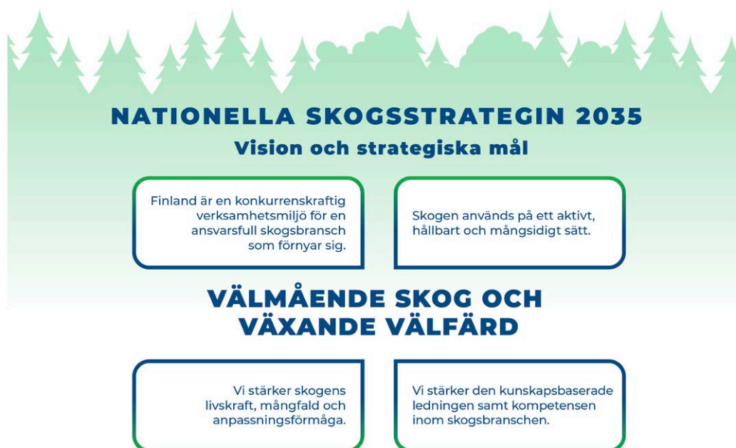
Figur 4. Skogsstrategins vision och mål.