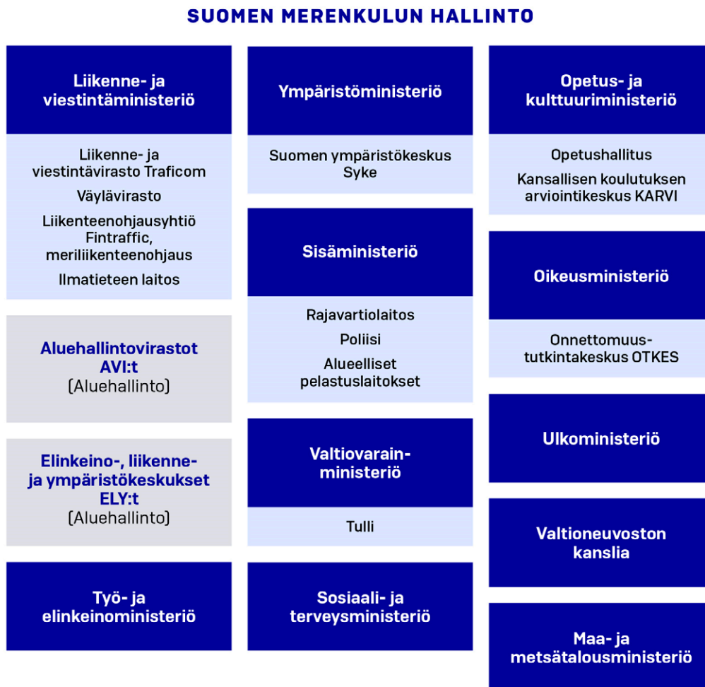
Kuvio 1. Merenkulun hallinto

Ministeriöiden ja virastojen organisointi ja vastuut perustuvat lainsäädäntöön. Meriturvallisuuteen, meriympäristöön, merenkulkuun ja meriliikenteeseen liittyvät tehtävät ja IMO:n sääntelyn toimeenpano kuuluvat erityisesti alla olevan kuvan mukaisten ministeriöiden ja niiden hallinnonalojen virastojen tehtäviin.