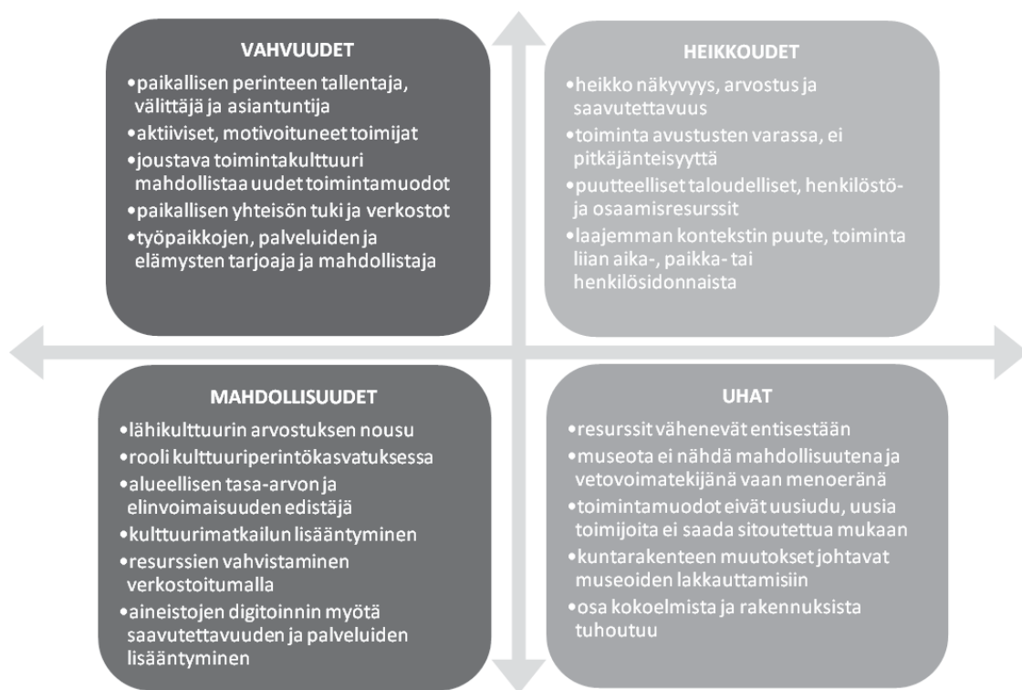
Kuva 1. Paikallismuseotoiminnan vahvuudet, heikkoudet, mahdollisuudet ja uhat.