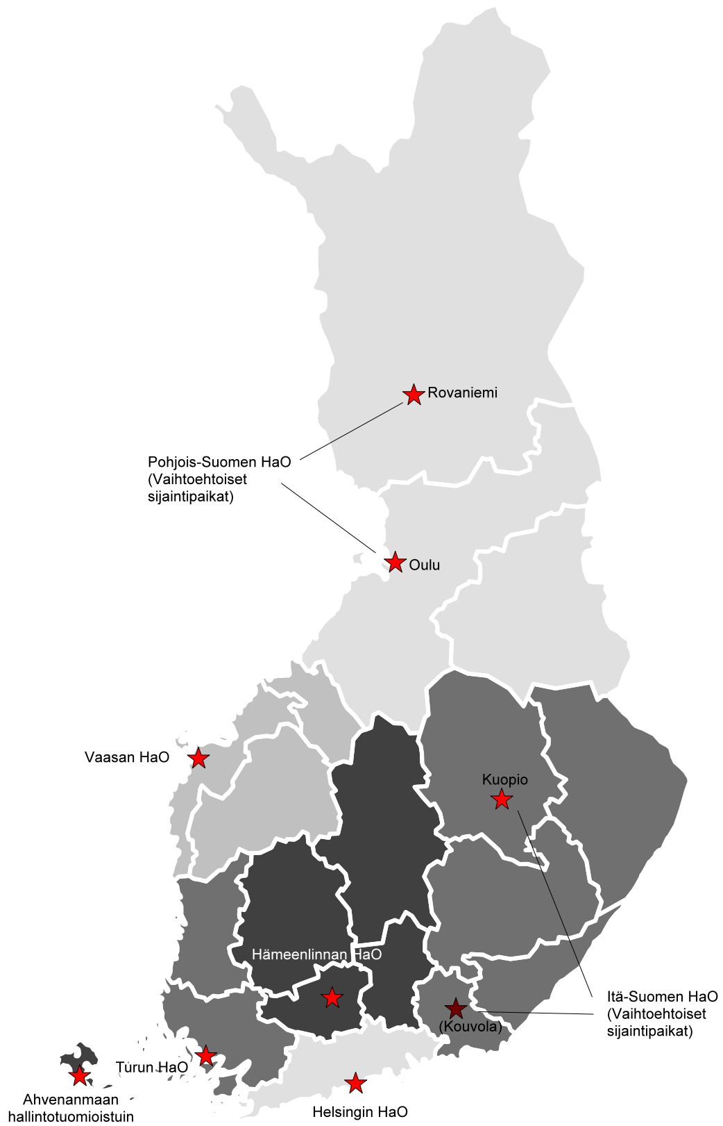
Kuva 5.2: Ehdotettu hallinto-oikeusverkosto