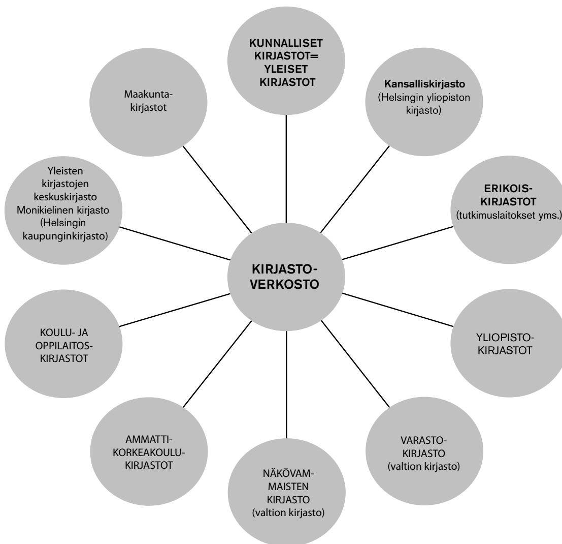
Kuvio 1: Kirjastoverkosto