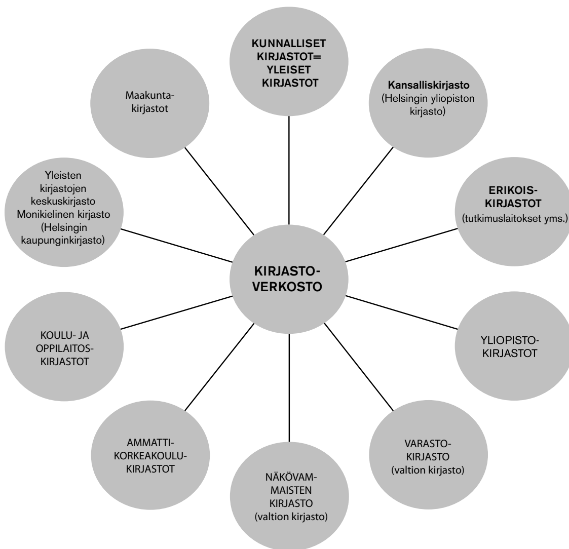
Kuvio 4: Kirjastoverkosto

Suomen kirjastoverkosto koostuu yleisistä eli kunnallisista kirjastoista, tieteellisistä ja ammattikorkeakoulukirjastoista, erikoiskirjastoista sekä kouluissa ja oppilaitoksissa olevista kirjastoista. Kirjastoja on lisäksi erilaisissa hallinnollisissa yksiköissä ja yrityksissä. Sekä kunnalliset että yliopistolliset kirjastot ovat kaikille avoimia.