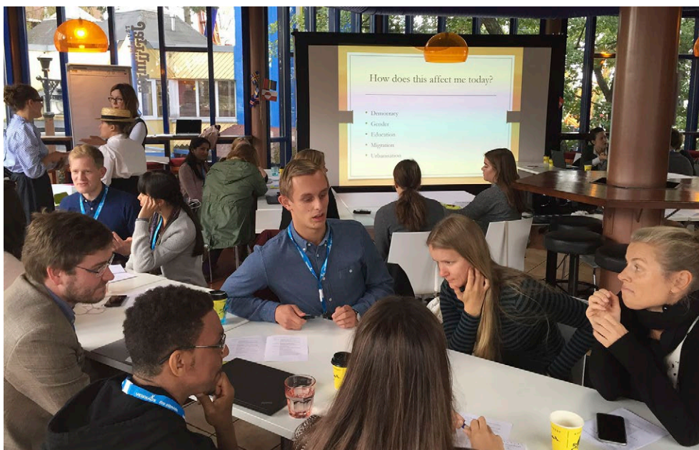
I den kulturella workshoppen funderade man på livet nu och för hundra år sedan.