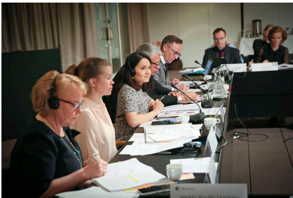
Kulturministermöte (MR-K 1/16) i Finlandiahuset 2.5.2016.