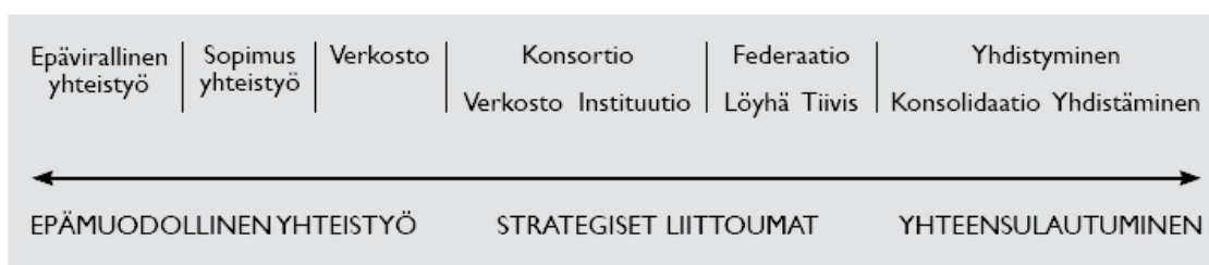
Kuvio 1. Korkeakoulujen yhteistyömallit.

Korkeakoulujen välinen yhteistyö yleistyi toisen maailmansodan jälkeen erityisesti kehittyneiden länsimaiden korkeakoulujärjestelmissä. Yhteistyön syventäminen on yleensä ollut vastaus korkeakoulujen toimintaympäristössä tapahtuneisiin sosioekonomisiin murroksiin. Murrokset ovat vaikuttaneet samalla korkeakoulujen toimintaedellytyksiin ja niiden muutostarpeisiin. Yhteistyöhankkeet ovat tavallisesti ilmenneet yhtäältä korkeakoulupoliittisina reformeina ja toisaalta korkeakoulujen strategisina pyrkimyksinä. Korkeakoulujen yhteistyömallit voidaan luokitella yhdellä tapaa kuvion 1 mukaiseen järjestykseen. Seuraavassa arvioidaan lyhyesti näistä konsortiota, federaatiota ja yhdistymistä.