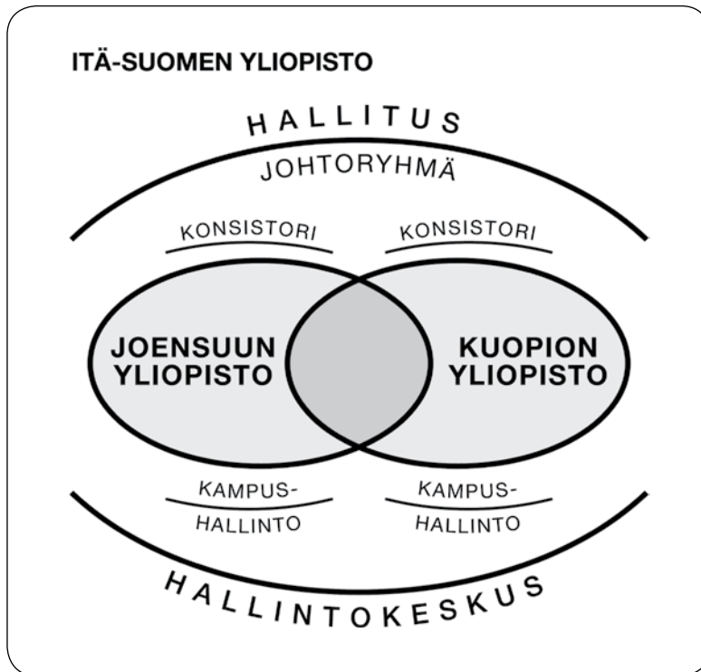
Kuvio 1. Itä-Suomen yliopiston toimintarakenne.

Liittoyliopiston toimintarakenne on havainnollistettu kuviossa 1.