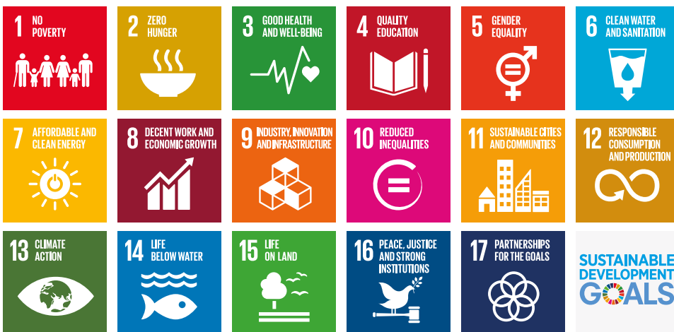
Bild 1. Målen för handlingsprogrammet för hållbar utveckling (Agenda 2030) (Sustainable Development Goals, SDG)

Agenda 2030 består av gemensamma principer, 17 mål och 169 delmål som preciserar målen, medel för genomförande samt ett gemensamt system för uppföljning och utvärdering av genomförandet. Målen för Agenda 2030 är globala och gäller på lika villkor i alla länder i världen. För att genomförandet ska lyckas krävs det deltagande och insatser av alla aktörer i samhället, men regeringen har huvudansvaret för att handlingsprogrammet genomförs och målen uppnås.