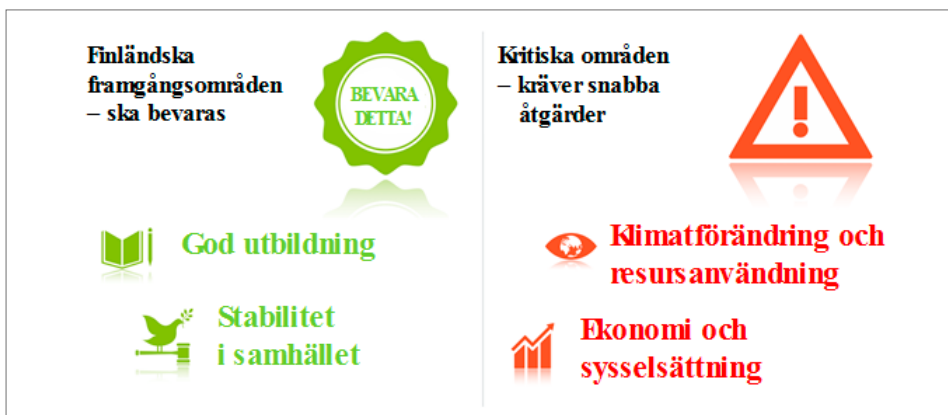
Bild 2. Centrala slutsatser i projektet Avain2030

Finlands utgångsläge har bedömts också i flera internationella undersökningar och utredningar. Undersökningar har genomförts av bl.a. OECD 5 , Eurostat 6 , stiftelsen Bertelsmann 7 samt Sustainable Development Solutions Network (SDSN) 8 . Dessa undersökningar och utredningar har använts vid utarbetandet av denna plan.