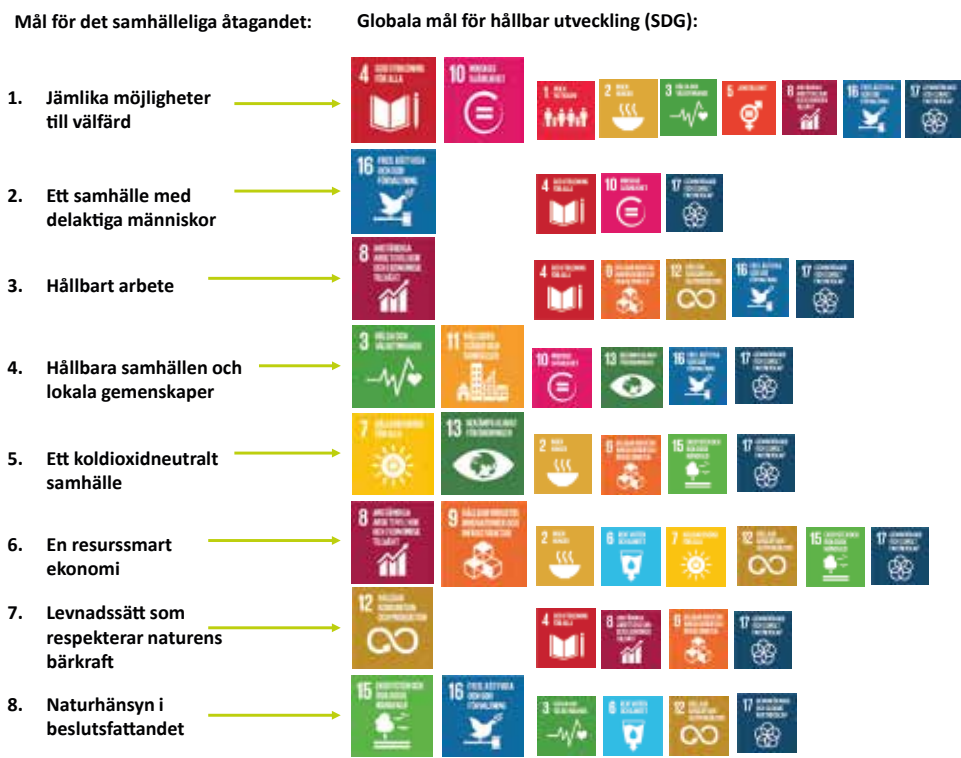
Bild 3: Överensstämmelsen mellan målen för dels det samhälleliga åtagandet, dels Agenda 2030 (SDG)