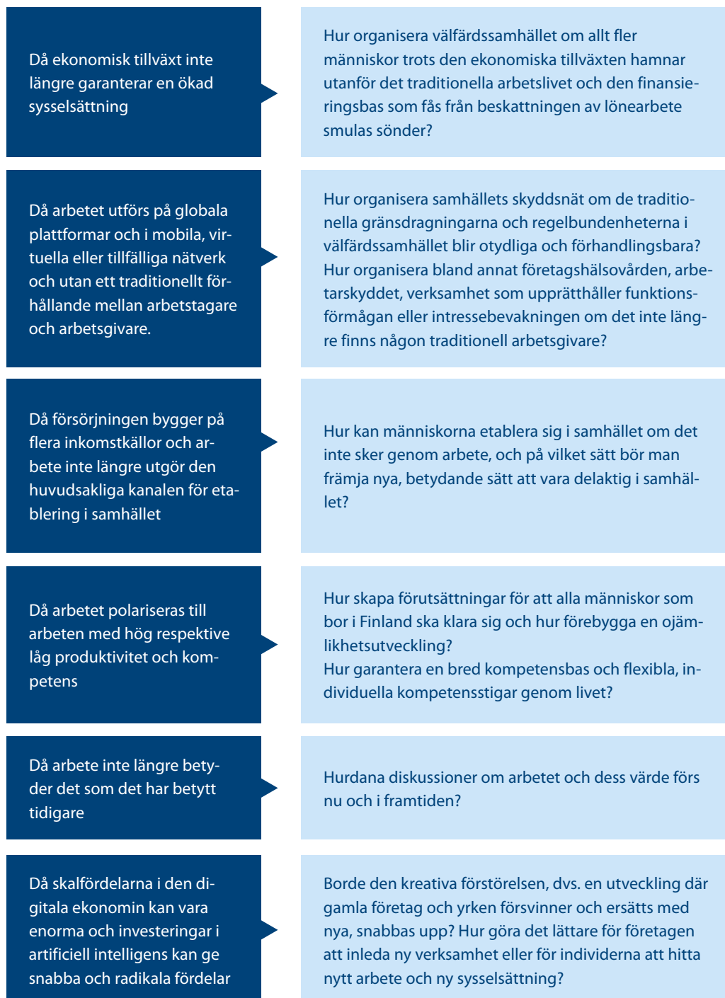
Figur 2. Förändringarna i arbetslivet och deras konsekvenser