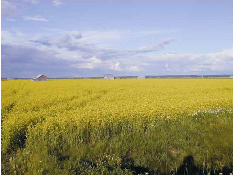
Bild 5. På Söderfjärdens imponerande odlingslätt finns fortfarande några lador och rior bevarade.

Om man ser på områdets skogar i mindre skala är skogsbrynen och skogsholmarna värdefulla element, som dock båda kräver viss skötsel för att bli riktiga pärlor i landskapet.