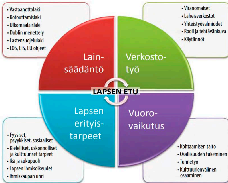
Kaavio 1. Edustajan osaamisalueet ja työn sisällöt (Lundqvist & Vaitomaa 2014, 124.)