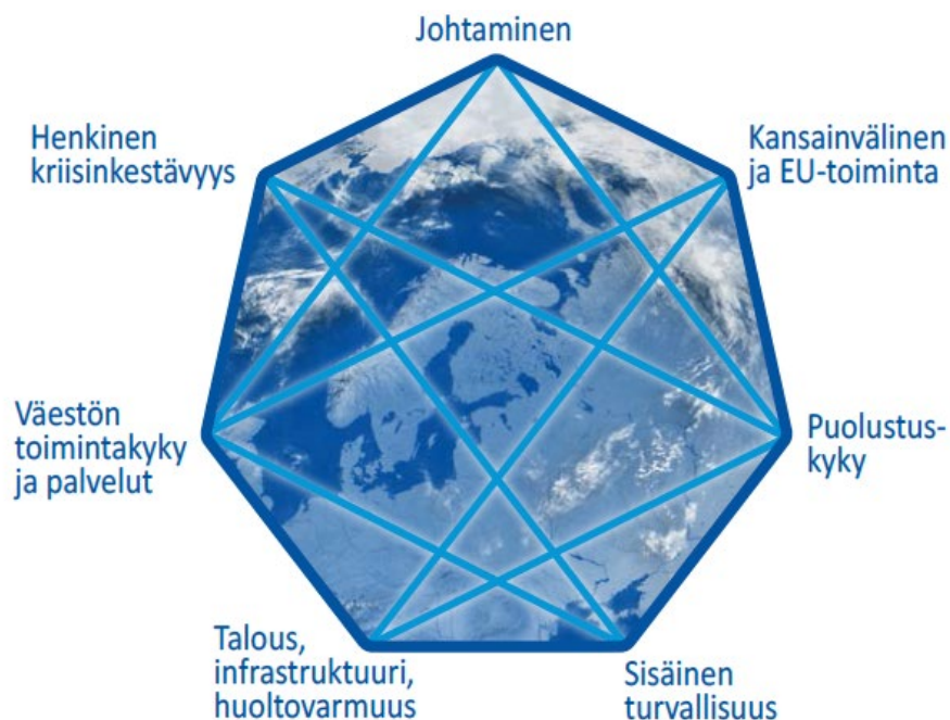
Kuva 1 Yhteiskunnan elintärkeät toiminnot (YTS 2017 s. 14)

Varautumisen päämääränä on huolehtia onnettomuuksien ja häiriötilanteiden ehkäisystä, valmistautumisesta toimintaan niiden uhatessa tai sattuesssa ja suunnitella toipuminen. Vastuullinen ja toimivaltainen viranomainen vastaa varautumissuunnittelusta ja siihen liittyvästä yhteistoiminnasta.