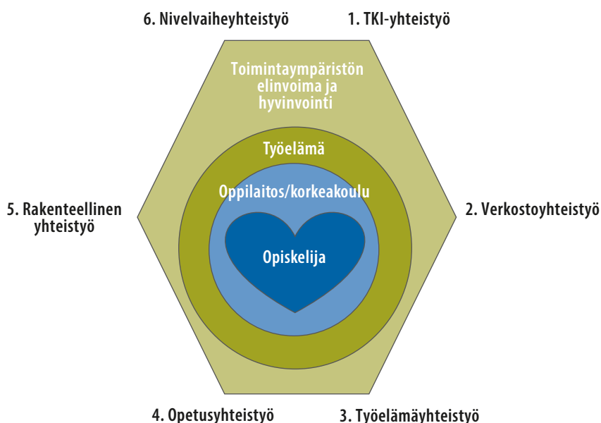
Kuvio 4. Jatkuvan oppimisen ja osaamisen kehittämisen timantti

Kehittämisryhmä kävi kokouksissaan läpi ammatillisen koulutuksen järjestäjien ja korkeakoulujen yhteistyön muotoja ja toimintamalleja lukioiden ja korkeakoulujen yhteistyötä käsitelleessä Katse korkealle -raportissa esiin nostettujen sekä ammatillisen koulutuksen järjestäjiltä ja korkeakouluilta kokoamiensa yhteistyön muotojen ja toimintamallien pohjalta. Olemassa olevien yhteistyön muotojen ja luvussa 4 määrittelemiensä ammatillisen koulutuksen ja korkeakoulutuksen yhteistyön tavoitteiden pohjalta kehittämisryhmä jäsenseli suosittelmansa yhteistyön muodot jatkuvan oppimisen ja osaamisen kehittämisen timantiksi , jossa on kuusi kulmaa (kuvio 4). Nämä kuusi kulmaa kuvaavat kehittämisryhmän suosittelimia ammatillisen koulutuksen järjestäjien ja korkeakoulujen yhteistyön muotoja. Kehittämisryhmän suosituksissa on timantin nimen mukaisesti kiinnitetty huomiota jatkuvan oppimisen edistämiseen, ei ainoastaan siirtymisestä suoraan toisen asteen ammatillisesta koulutuksesta jatko-opintoihin korkeakouluun. Timantin eli yhteistyön ja kaiken toiminnan keskiössä on opiskelija ja myös työ- ja elinkeinoelämä, johon sekä ammatillisen koulutuksen että korkeakoulutuksen opiskelijakin viime kädessä tähtää. Tavoitteena on yksilön ja työ- ja elinkeinoelämän osaamistarpeisiin vastaaminen ja työelämän kehittäminen ja sitä kautta toimintaympäristön elinvoima ja hyvinvointi.