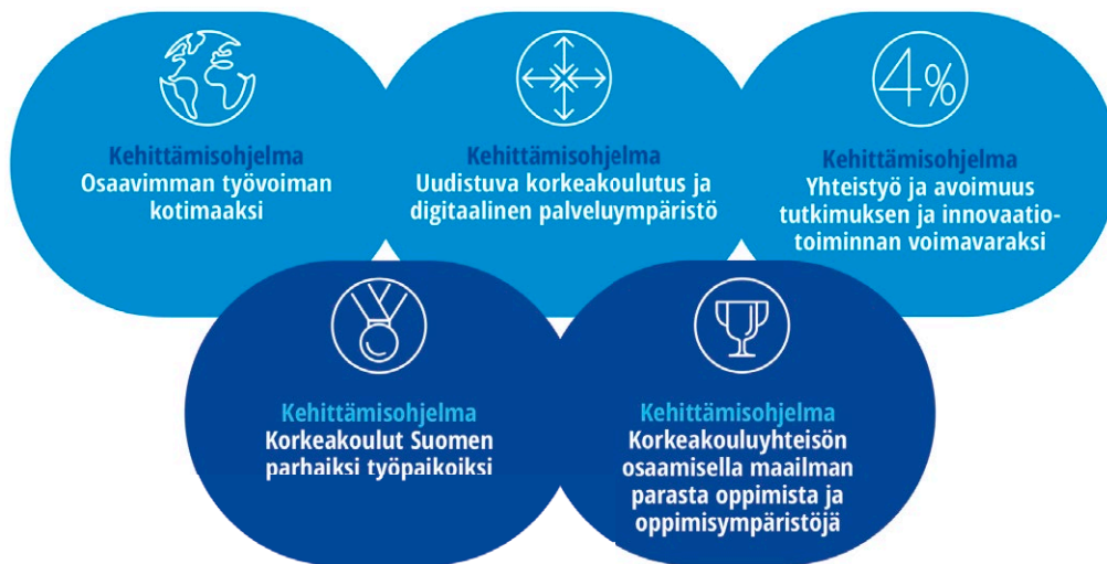
Kuvio 2. Tiekartan viisi kehittämisohjelmaa

Kehittämisohjelmien toimeenpano alkaa vuoden 2019 aikana. Tiekartan toimeenpanon käynnistymistä ohjaa vision toimeenpanon johtoryhmä.