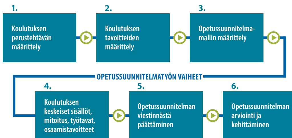
Kuva 1. Prosessikaavio opetussuunnitelmatyön vaiheista (Maria Miettinen, Valtioneuvoston kanslia 2019)

opetussuunnitelmatyötä. On pohdittava myös, miten opiskelijat, opettajat ja muut sidosryhmät sitoutetaan mukaan kehittämiseen.