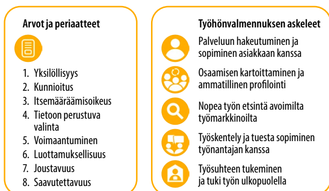
Kuvio 3. Laatuksiteereihin perustuva tuetun työllistymisen työhönvalmennus.