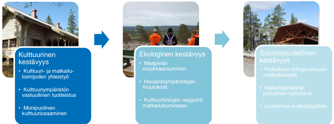
Kuvio 2. Vierailukestävyden kolmiomittausmallin ilmiökokonaisuudet

Vierailukestävyyden kolmiomittausmalli asettaa kulttuurisen kestävyuden tarkastelun keskiöön, huomioi ekologisen kestävyuden ja sitoo taloudellisen kestävyuden sosiaaliseen kestävyteen : paikallisten yhteisöjen ja asukkaiden hyvinvointiin.