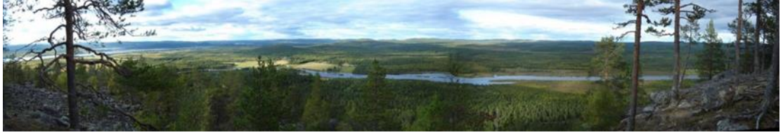
Näkymä Aavasaksalta (Wikimedia Commons)