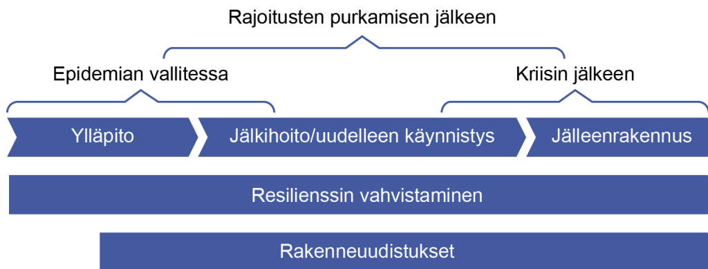
Kuva 2: Yhteiskunnan tukitoimet kriisin eri vaiheissa

Vaikka ylläpito-, jälkihoito- ja jälleenrakennusvaiheet lomittuvat ajallisesti, voidaan niiden välistä yhteyttä kuvata jatkumona kuvan 2 mukaisella tavalla. Koska epidemian etenemiseen liittyy epävarmuuksia ja koska tietoa koronaviruksesta, epidemian etenemisestä ja rajoitustoimien vaikutuksista kotimaassa ja ulkomailla saadaan jatkuvasti lisää, tulee kriisin jälkihoito- ja jälleenrakennusstrategian olla samaan tapaan itseään päivittävä prosessi kuin akuutin kriisivaiheen epidemian hallinnan hybridistrategia. Epidemiatilanteen muuttuessa, tulee rajoitustoimien lisäksi päivittää myös niihin liittyviä tukitoimia. Kriisin eri vaiheesta toiseen siirtyminen on merkittävä päätös ja toimenpide, jota tulee tukea aktiivisella ja mahdollisimman reaaliaikaisella seurannalla erityisesti kriisivaiheesta jälkihoitoon siirryttäessä