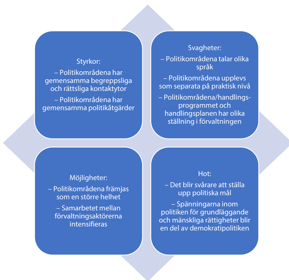
Figur 3. Kombinerad av demokratipolitiken och politiken för grundläggande och mänskliga rättigheter, SWOT-analys.

De grundläggande och mänskliga rättigheterna, demokratin och rättsstaten har en stark ömsesidig koppling som tar fasta på såväl delaktigheten som begreppens rättsliga dimension. De tjänsteinnehavare och företrädare för det civila samhället som vi intervjuat i samband med utvärderingen ansåg att minskningen av ojämlikheten i det samhälleliga deltagandet är en central åtgärd med tanke på kopplingarna mellan politiken för grundläggande och mänskliga rättigheter och demokratipolitiken. Ur rättslig