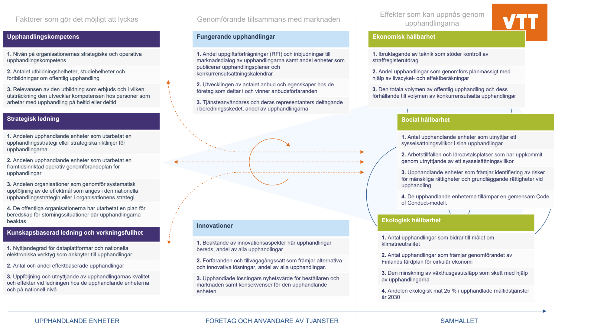
Figur 2. Den övergripande modellen och strategins indikatorer enligt strategisk avsikt

Indikatorerna främjar och beskriver även förverkligandet av och framsteg i fråga om de övriga strategiska avsikterna.