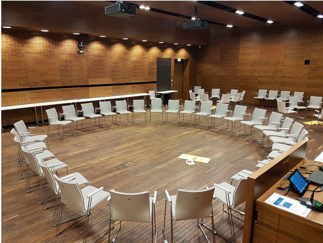
Kuva 2. Alueellisissa tilaisuuksissa ei ollut etu- eikä takariviä.