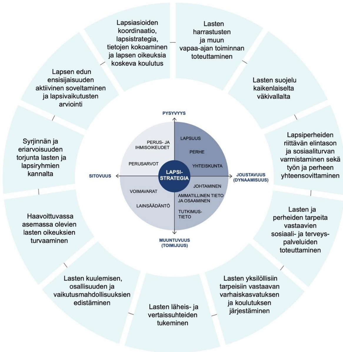
Kuvio 1. Lapsistrategian asema lapsia koskevan päätöksenteon ja toiminnan perustana ja kehällä lapsistrategiassa huomioitavat kokonaisuudet. (Iivonen & Pollari 2020, s. 21)

Raportin luvut on pääosin rakennettu niin, että kunkin pääluvun aluksi esitetään keskeisimmät havainnot koronakriisin vaikutuksista lasten, nuorten ja perheiden oikeuksien toteutumiseen (kursiivilla), ja sen jälkeen esitetään kunkin luvun tai alaluvun osalta tilannekuva koronakriisin vaikutuksista lapsiin, nuoriin ja lapsiperheisiin. Kunkin luvun ja alaluvun lopuksi on työryhmän esitykset tarvittaviksi toimenpiteiksi. Toimenpiteiden tavoitteena on lieventää koronakriisin kielteisiä vaikutuksia lapsiin, nuoriin ja lapsiperheisiin sekä turvata ja edistää lasten, nuorten ja lapsiperheiden hyvinvointia ja oikeuksien toteutumista koronakriisissä ja sen jälkeisenä aikana.