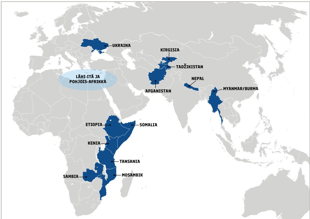
Suomen kahdenvälisen kehitysyhteistyön kumppanimaat vuonna 2021.

järjestöjen ja rahoituslaitosten vahvuuksia ovat laaja maantieteellinen ja temaattinen kattavuus, käytettävissä olevan rahoituksen suuri volyymi, hyvä toimintakyky sekä vaikuttavuus.