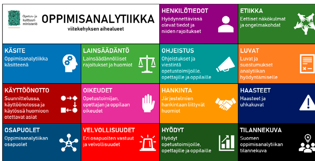
Kuva 1. Viitekehysten aihealueet

Kiireinen lukija voi puolestaan hyödyntää johdantoluvun lopusta löytyvät viitekehysten top 15 -nostot (s. 21–25) ainoastaan keskeisimpien kysymysten läpikäymiseksi tai tilanteeseensa tärkeimmiksi näkemiensä teemojen löytämiseksi.