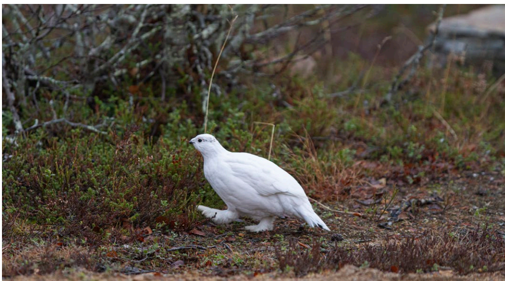
Kuva 5. Riekko on jo valmistautunut talveen vaihtamalla höyhenpeitteensä valkoiseen sulautukseen lumiseen maisemaan, vaikka lunta ei vielä ole. Ilmastonmuutoksen seurauksena lumipeite saapuu syksyllä nykyistä myöhemmin ja sulaa keväällä aiemmin.