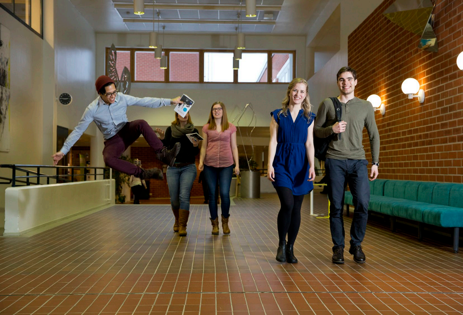
Kuva 13. Suomessa on runsaasti arktiseen tutkimukseen liittyvää korkeatasoista osaamista ja toimijoita koko maassa. Tutkimusta tehdään muun muassa korkeakouluissa ja usein monitieteisesti.

Valtioneuvoston selvitys Suomen arktisen rahoituksen kokonais kuvasta (2019:1) tunnisti ongelmaksi arktisen rahoituksen merkittävän sirpaleisuuden. Tämä koskee myös tutkimustyötä, jossa projektien huomattava määrä samalla siilouttaa kokonaisuutta ja tuottaa epä-jatkuvuutta. Tutkimuksen suuresta volyymista huolimatta Suomen arktisen tutkimuksen kokonaiskuva on huonosti saatavilla.