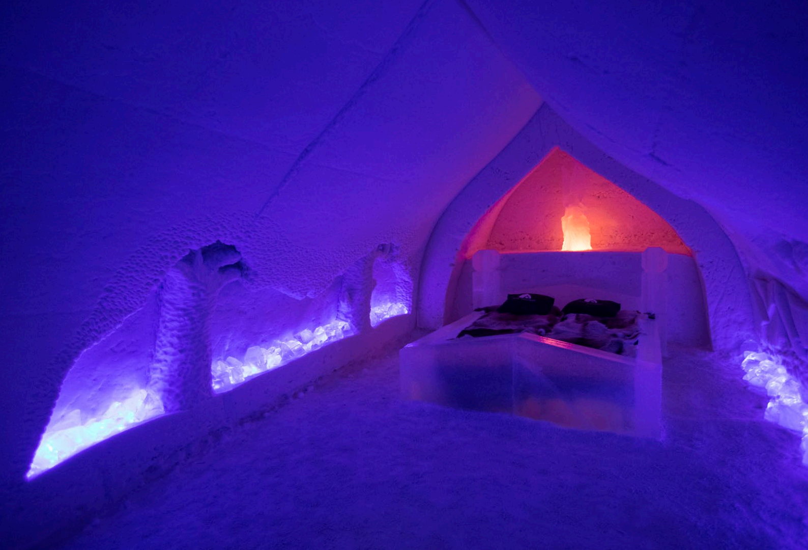
Kuva 12. Lumihotelli edustaa innovatiivista matkailurakentamista. Joka vuosi rakennettavat lumihotellit ovat ulkomaalaisten matkailijoiden suuri nähtävyys ja ainutlaatuinen kokemus.

Arktisen alueen matkailun kasvun perustana on alueen erityisyys etenkin luonnon mutta myös kulttuurin puolesta. Kestävän ja vastuullisen matkailun kehittämisessä tulee huomioida ympäristönäkökulmien lisäksi laajasti sosiaaliset, kulttuuriset ja taloudelliset näkökulmat. Matkailijamäärien kasvattamisen sijaan tulee panostaa matkailijoiden viipymän ja rahankäytön kasvattamiseen, laadukkaiden ja hyvin paketoitujen tuotteiden sekä luonnon kannalta kestävien palveluiden avulla.