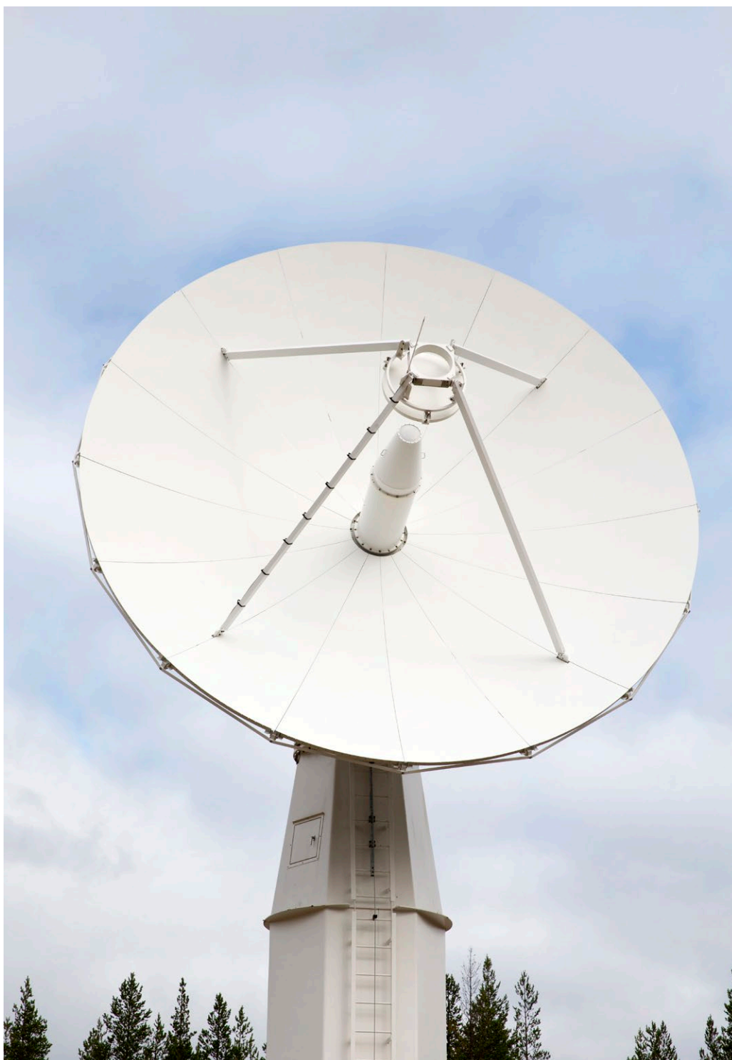
Kuva 15. Arktinen avaruuskeskus vastaa Sodankylän kansallisesta satelliittidatakeskuksesta.