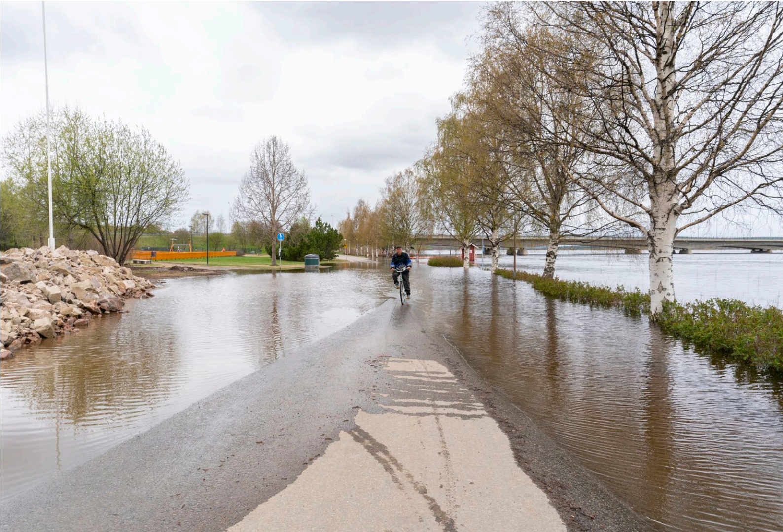
Kuva 7. Kevättulva. Kuva Rovaniemen keskustasta, jossa Kemijoki tulvii kaduille keväällä 2020.