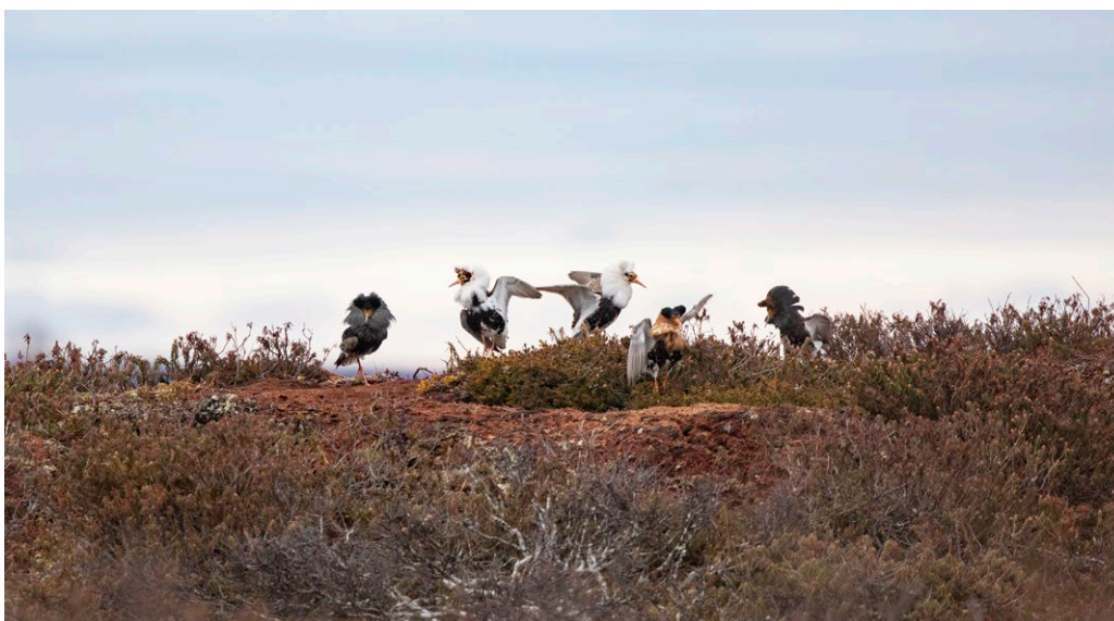
Kuva 6. Suokukkopalsa. Suokukko on ilmastonmuutoksen myötä muuttunut Suomessa erittäin uhanalaiseksi lajiksi. Suokukot ovat perinteisesti soidintaneet Utsjoen palsasoiden palsoilla, jotka nekin ovat sulaneet lämpenemisen myötä. Nämä linnut yrittävät yhä soidintaa alueen viimeisen palsan päällä.