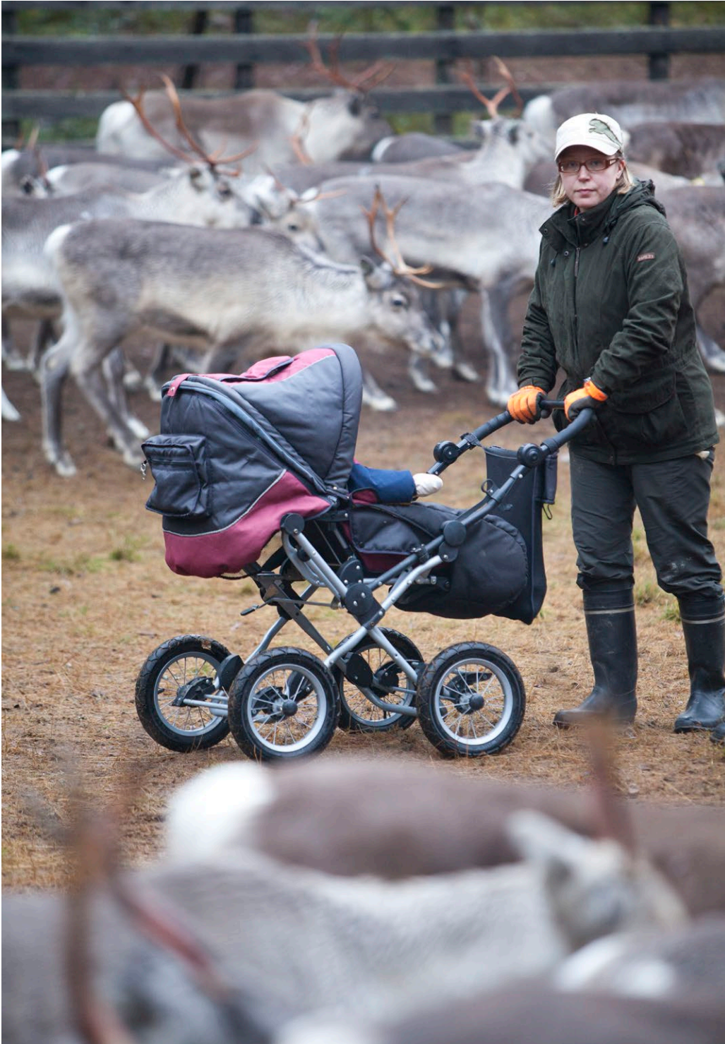
Kuva 9. Poronhoito kulkee perheissä sukupolvelta toiselle, ja lapset ovat mukana porotöissä jo vauvasta lähtien.