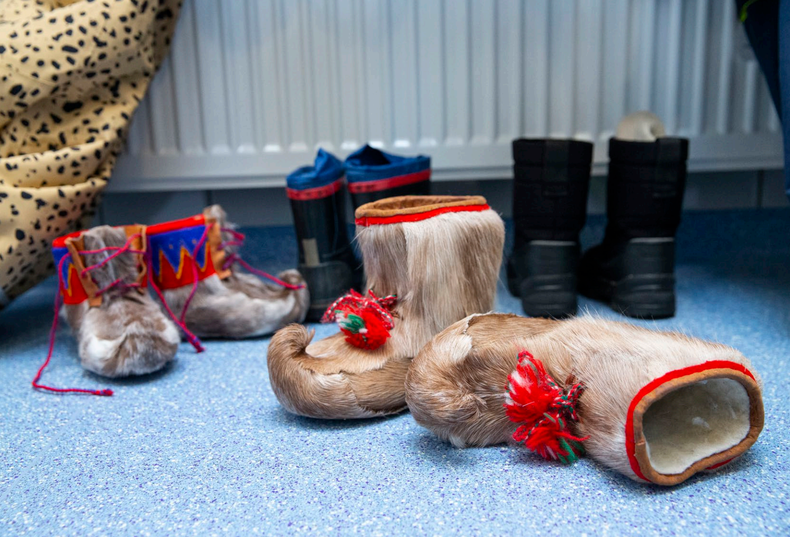
Kuva 10. Saamenkielisessä alle kouluikäisten kielipesässä on sekä suomenkielisiä että saamenkielisiä lapsia.

Arktisen alueen alueellista, sosiaalista ja taloudellista kehitystä tukee erityisen huomion kiinnittäminen alkuperäiskansojen perinnetiedon ja perinteisten kulttuuri-ilmausten suojaan henkisenä pääomana (aineettomat oikeudet, IP – Intellectual Property). Suomi on panostanut saamelaisten henkisen omaisuuden suojaa koskevien kysymysten tutkimukseen sekä kansainvälisesti että kansallisesti yhdessä Saamelaiskäräjien kanssa.