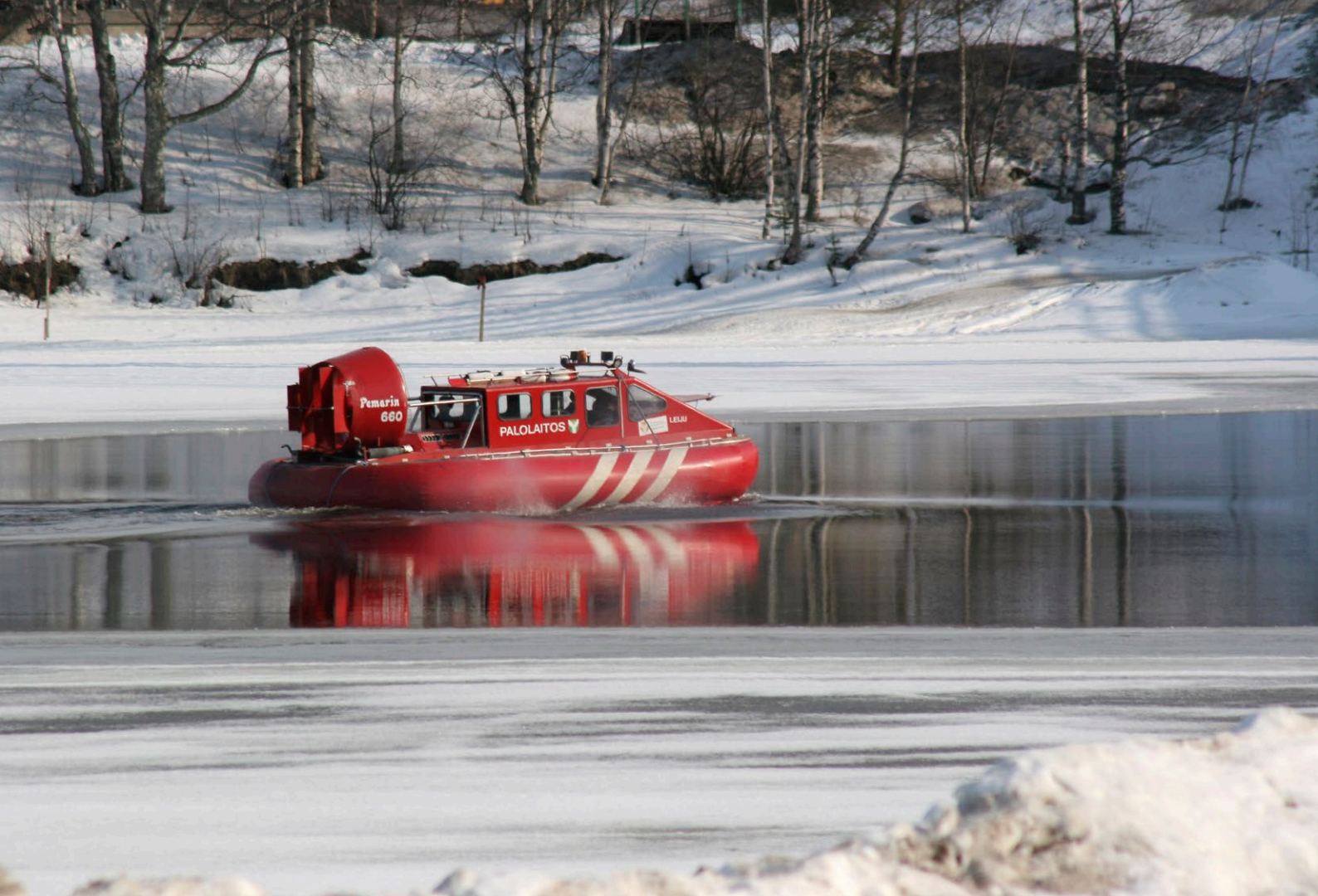
Kuva 4. Ilmatyynyalus on tärkeä työkalu pelastuslaitoksille kelirikon aikana.

Vakaa ja turvallinen toimintaympäristö on edellytys arktisen yhteistyön ehdotettujen tavoitteiden toteutumiselle ja alueen väestön hyvinvoinnin edistämiseksi. Tämän vuoksi myös sisäinen turvallisuus sekä turvallinen elin- ja toimintaympäristö tulee huomioida keskusteluissa ja alueen kehittämisessä.