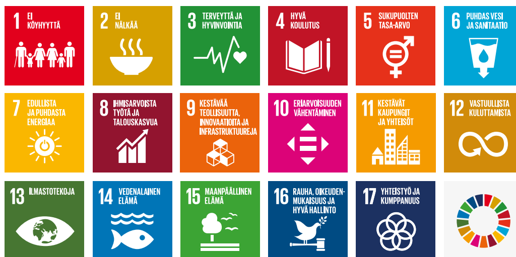
Kuva 1. Kestävän kehityksen toimintaohjelma Agenda2030. Toimintaohjelma sisältää 17 kestävän kehityksen tavoitetta. 1

Pohjois-Euroopan turvallisuus on kasvavassa määrin yksi kokonaisuus, jossa turvallisuustilanteen muutokset Itämeren alueella, Suomen arktisilla lähialueilla sekä Pohjois-Atlantilla kytkeytyvät tiiviisti toisiinsa. Kasvava turvallisuuspoliittinen mielenkiinto arktiselle alueelle tekee siitä myös Suomen ulkopoliittisen toiminnan merkittävän painopistealueen.