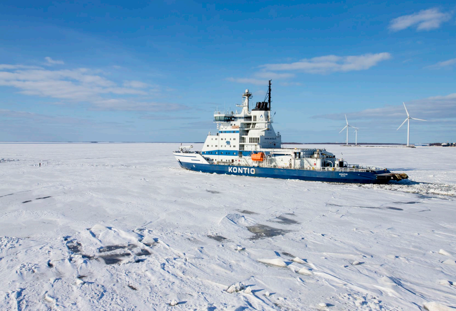
Kuva 11. Jäänmurtaja Kontio liikennöi Perämerellä pitäen väylät auki läpi talven. Taustalla Kemin edustalla sijaitsevat tuulimyllyt.

Selkeisiin, lyhyen aikavälin, vientimahdollisuuksiin tarttumisen lisäksi tulee tukea ja vaikuttaa myös arktisen alueen pidemmän aikavälin taloudelliseen kehitykseen. Kestävää kehitystä korostava toimintatapa vahvistaa innovaatiomyönteisen markkinan syntyä arktiselle alueelle. Tämä markkina houkuttelee alueelle uusia yrityksiä, toimijoita ja investointeja.