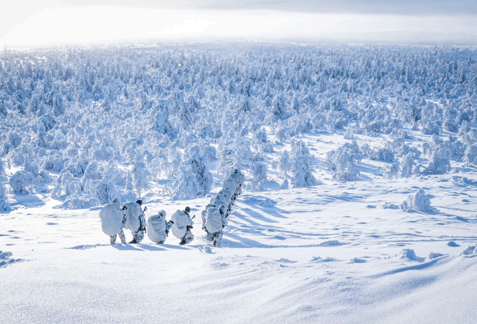
Kuva 3. 3. Jääkärikomppanian komentojoukkueen jalkamarssi Kaarestunturille talvella 2019.

Puolustusvoimat osallistuu arktiseen tutkimusyhteistyöhön ja harjoittelee pohjoisessa sekä kansallisesti että yhdessä kumppaneidensa kanssa. Suomen vahvuus on kokonaisuutena arktisiin oloihin soveltuvaksi rakennetut suorituskykyiset puolustusvoimat, jolla on kansainvälisesti korkeatasoista arktista osaamista.