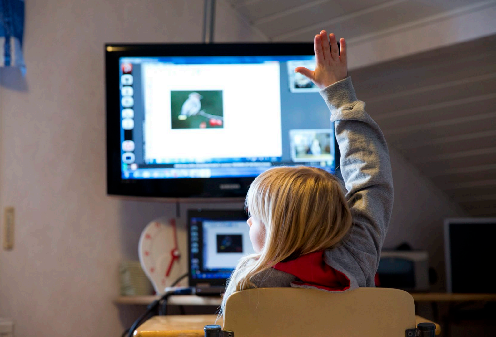
Kuva 8. Pitkän koulumatkan vuoksi sallalainen oppilas käy etäkoulua.

Tasapuoliset koulutusmahdollisuudet syrjäisillä alueilla niin perus- kuin toisella asteella ovat keskeisessä asemassa kestäväen kehityksen luomisessa ja arktisten yhteisöjen kestävyyn rakentamisessa. Hyvän perusopetuksen tasavertainen saatavuus avaa ovet toiselle asteelle ja korkeakouluihin sekä paikan löytämiseen työelämässä. Se vähentää syrjäytymisvaaraa ja sen negatiivisia seurauksia. Lisäksi toisen asteen koulutuksen riittävä saavutettavuus on tärkeää ottaen huomioon myös laajentuva oppivelvollisuus sekä syrjäytymisen ehkäisy.