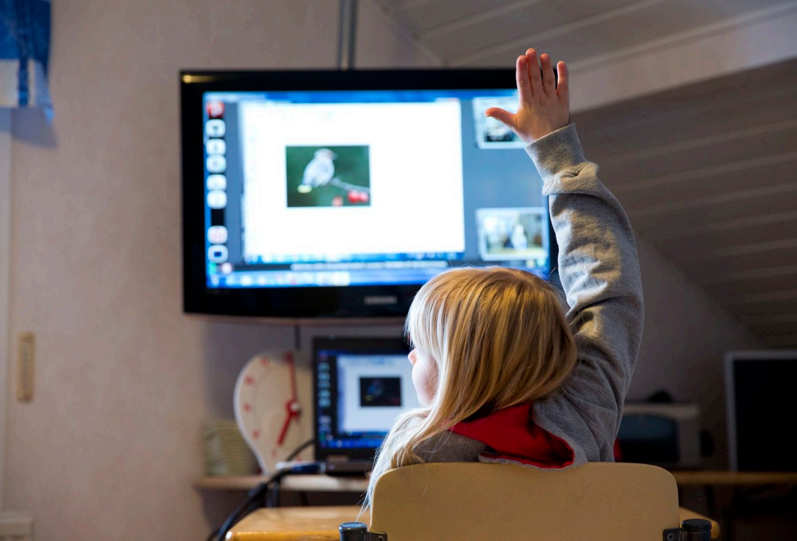
Kuva 8. Ku'kes škoolmäät'k diött Salla áaraž mátt'töötti jáátt ougglõs-škool. Sniimmi: Kaisa Sirén

Tää'sspeällsaž škooltõsvuei'ttemvuõđ čárvuu'din nu'tt vuáđđ- go še nu'bb tää'zzest lie kõskksaž sâá'jest keáll'jeei ouddnummuž raajmõõžžâst da aarklaž õoutstõõzzi keáll'jemoodd raajmõõžžâst. Šiõgg vuáđđmátt'tõõzz tää'ssverddsaz vuážžamvuõtt äavad uusid nu'bb tässa da õllškoolid di päai'k kaunmõ'sše tuáj-jie'llmest. Tõt kie'ppad čárstumušvää da tøn negatiivlaž seu'rrjõõzzid. Láâ'ssen nu'bb tää'zz škooltõõzz ri'jtteei vuážžamvuõtt lij vääžnai go vää'ldet lokku še veiddneeí máttjemõõlgttemvuõtt da čárstumuž cõõggõõttmõš.