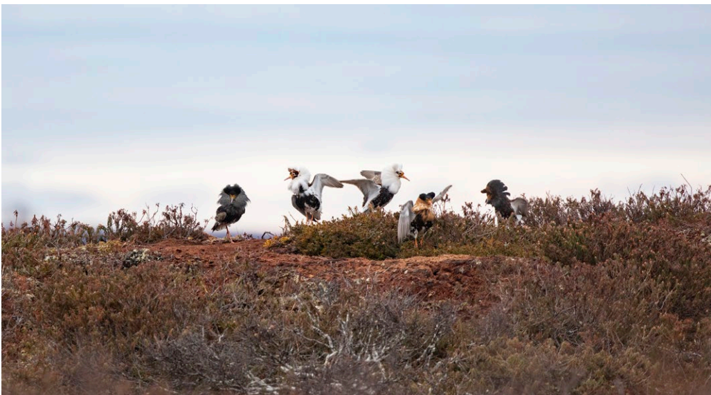
Kuva 6. Rei'mmrääumažpou'nñj. Rei'mmrääumaž lij äimmõsmuttâz mie'ldd šõddâm Lää'ddjännmest samai vaarvuâlaž šlaajjân. Rei'mmrääuma lie ä'rbbvuõđlânji ķe'mmääm U'ccjoogg taaljie'ğğ pou'nñjin, kook še lie suddâm pakknummuž mie'ldd. Tâk lãâdda kâi'tte õinn ķe'mmeed vuu'd mââimõs taaljeä'ğğpou'nñj â'lnn.