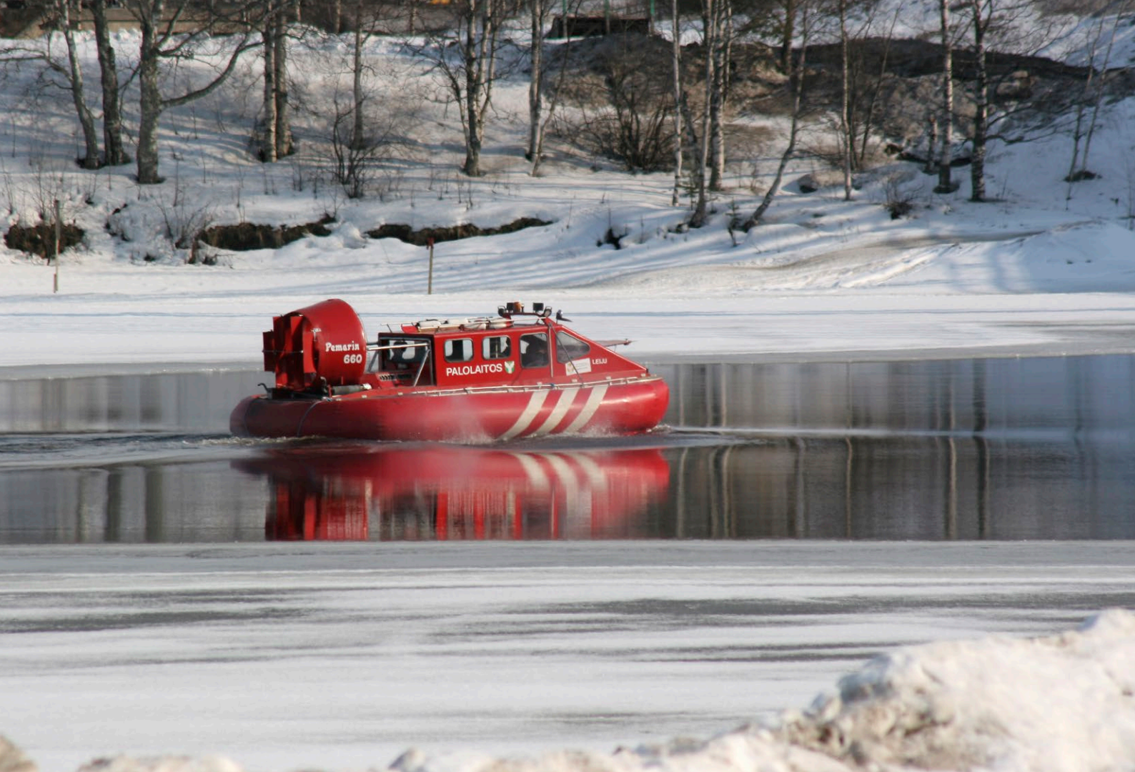
Kuva 4. Äimmpooddâšk-käärab lij vääžnai tuâjjneävv peälštemstroittlid roospot ääi'j.

Jeä'rben Tâ'vvjännmi kōōskâst tåimmai tâ'vven ju'n åå'n ööldås da vuōigg ve'rġġnii'kĳi kōōksaž öhttsažtuâjj nu'tt pāå'les, Tuål, Raajjväärdtōkstroo'ttel gu še peälštemtååim vue'zzest. Ve'rġġne'kĳkōhttsažtuâj määŋgai kōōksaž, vooudlaž da kuei'tkōōksaž rajjsin ålgg jue'tĳkest vä'ldded lokku öinn jäänab aarktlaž vuu'd ooudâsviikkmōōžžâst kaggōōtti vuei'tlvaž va'žžtōōzz da taarbid. Raajjväärdtōkstroo'tel lij aktiivlånji mie'ldd aarktlaž reddväärdtōkōhttsažtuâjast (ACGF, Arctic Coast Guard Forum), mōōn raamin ĳiōtt'tōōlåt miårlaž ve'rġġnii'kĳi tåimmjummuž obb aarktlaž vuu'dest.