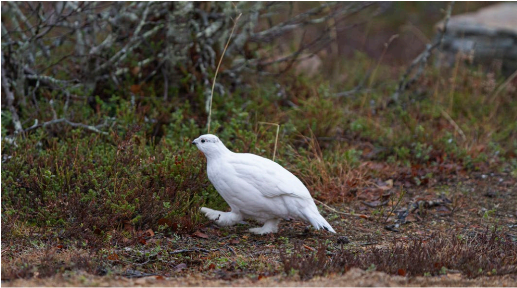
Kuva 5. Repp lij ju'n valmštõõttâm tälvva go lij vaajtam p03300'le viõlggsen, što vuäitči lõõmmâd tä'lvvkue'stlma, hâ't-i lij vól muõttgâ'ttem. Äimmõsmuttâz seu'rrjõssân kuâlddvõcc eett čâhčča ân'n'jõõžž mâ'ηηlest da sodd ķeâđđa ääi'jab.