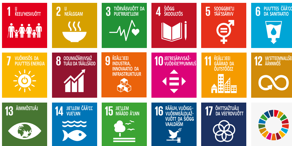
Govva 1. Suvdilis gárggiideami doaibmaprogramma Agenda2030. Doaibmaprogrammii gullet 17 suvdilis gárggiideami ulbmila. 1

Strategiija álggus ovdanbuktojuvvojit, ovttalágánin stáhtaráði olgo- ja dorvvolašvuotapolitiikhkalaš čilgehusain, ártkalaš guovllu riikkaidgaskasaš doaibmabiras ja dorvvolašvuoda gažaldagat. Dán oasis deattuhuvvo riikkaidgaskasaš ovttasbarggu mearkašupmi ja gieđahallojuvvojit riikkaidgaskasaš ártkalaš ovttasbarggu guovddášráhkadusat. Davvi-Eurohpa dorvvolašvuolta lea šaddi mearis okta ollisvuolta, mas dorvvolašvuotadili rievdamat Nuortameara viidodagas, Suoma ártkalaš lagasguovlluin sihke Davvi-Atlánttas čatnasit lávga nuppiidasaset. Šaddi dorvvolašvuotapolitiikhkalaš beroštupmi ártkalaš guvlui dahká das maid Suoma olgopolitiikhkalaš doaimma mearkašahtti deaddočuokkesguovllu.