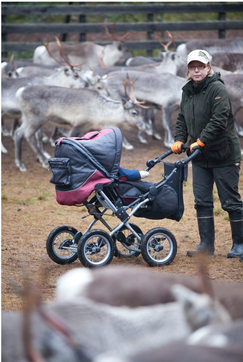
Govva 9. Boazobargu sirdása bearrašiin buolvvas nubbái, ja mánát leat mielde boazobargguin juo njuoratmáná rájes.