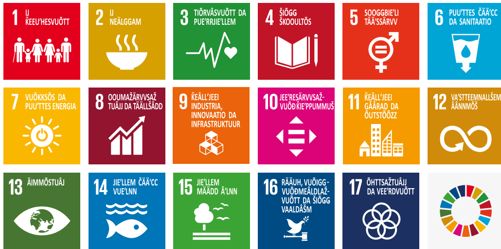
Kove 1. Kilelis ovdánem toimâohjelm Agenda2030. Toimâohjelm siskeeld 17 kilelis ovdánem mittomere. 1

Strategia aalgâst oovdânpuâhtojuh arktâsii kuávlun almuĵikkoskâsâš já torvolâšvuotâkoččâmušah ohtâlávtt statârâädi olgo- já torvolâšvuotâpooliitlii čielgâdâssáin. Almuĵikkoskâsii ohtsâšpargo merhâšume tiäduttuvvoo já kuávdâš almuĵikkoskâsii arktâsii ohtsâšpargo ráhtuseh kiedâvuššojeh taan uásist.