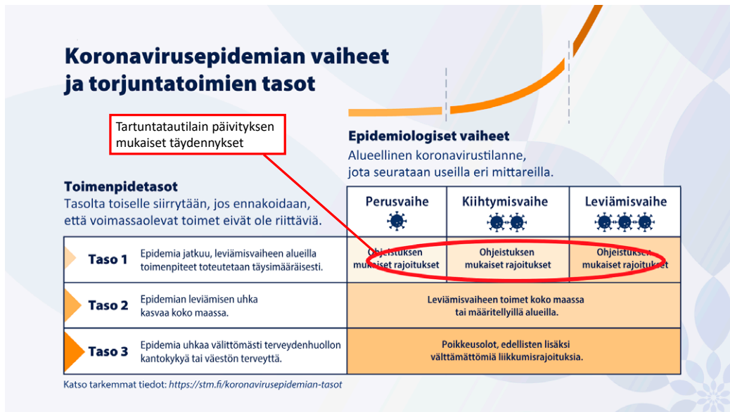
Kuva 1. Epidemian vaiheet ja torjuntatoimet helmi-huhtikuussa 2021.

Vuoden 2021 alussa maailmanlaajuisen COVID-19 pandemian yhteenlasketut tapausmäärät puolittuivat viidessä viikossa. Euroopassa kehitys oli ensin samansuuntainen, ja myös kuolleisuus COVID-19 -tautiin kääntyi selvään laskuun. Ilmiö oli ainakin osaksi laajojen rajoitustoimien seurasta. Uusia kiihtymisvaiheita on sittemmin kuitenkin käynnistynyt pohjoisen pallonpuoliskon talviaikana, sillä rokotukset eivät useimmissa maissa ole vielä olleet