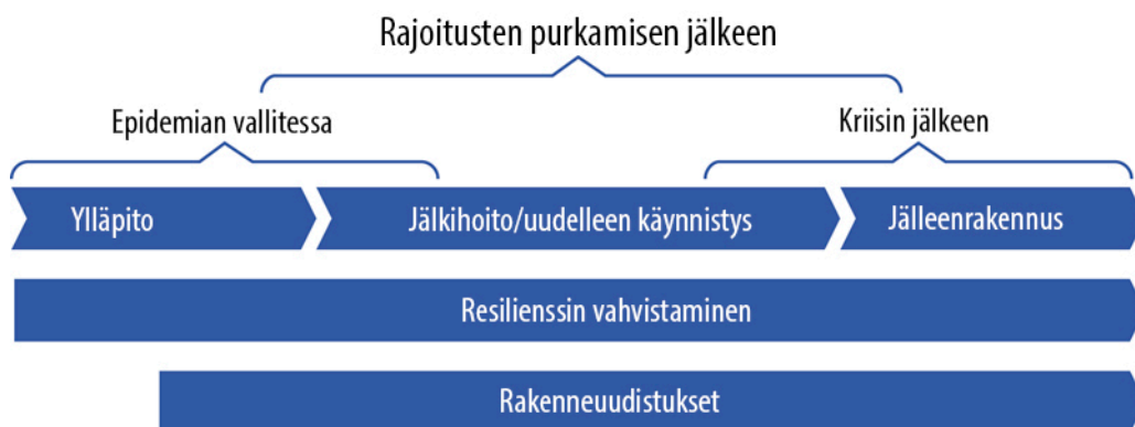
Kuva 5. Yhteiskunnan tukitoimet kriisin eri vaiheissa.

Monet pandemian taloudelliset ja toiminnalliset vaikutukset ovat globaaleja ja johtuvat ihmisten ja yritysten reagoinnista tilanteeseen. Kotimaisella politiikalla on voitu vahvistaa luottamusta siihen, että kriisistä selvitään. Suomen talouskehitys on ollut epidemian aikana muuta Eurooppaa suotuisampaa.