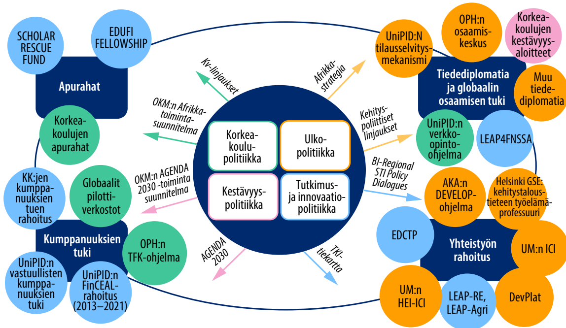
Kuvio 2. Suomen globaalivastuun ja kehitystoiminnan rahoituskenttä on sirpaleinen: olemassa olevat instrumentit ovat rahoitukseltaan riittämättömiä, toisistaan erillisiä ja pääosin sidottuja tiettyjen hallinnonalojen poliittisiin linjauksiin. Kuvio: Johanna Kivimäki, UniPID

Alaryhmän työn mukaan globaalivastuullisen rahoitusohjelman perusajatuksena on edistää Agenda 2030:n tavoitteita ja tukea suomalaista korkeakoulutus-, tutkimus-, innovaatio- ja kapasiteetin vahvistamisyhteistyötä globaalivastuun kumppanien kanssa sekä näihin liittyvää liikkuvuutta. Ohjelma on maantieteellisesti rajattu yhteistyöhön matalan ja keskitulon maiden kanssa, joihin termillä globaalivastuun tässä yhteydessä viitataan. Ohjelma parantaa olemassa olevan rahoituksen ja tukitoimien hyödyntämistä kokoamalla ja kehittämällä Suomen sirpaleista rahoituskenttää sekä vahvistamalla kansallista yhteistyötä eri toimijoiden ja instrumenttien välillä, tukien myös EU-, multilateraalivastuun ja muun kansainvälisen rahoituksen saamista. Ohjelmakokonaisuutta täydennetään luomalla identifioituihin tuen tarpeisiin vastaava rahoitusinstrumentti.