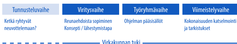
Kuvio 2. Hallitusneuvotteluiden prosessin päävaiheet.

Hallitusneuvotteluita voi pitää ”Suomen tärkeimpänä neuvotteluprosessina”. Neuvotteluiden tarkoituksena on ennen kaikkea sopia, mitä hallitus aikoo kaudellaan saada aikaan. Hallitusneuvottelut ovat vetäjänsä näköinen poliittinen prosessi, ja erot eri hallitusneuvotteluiden välillä voivat olla suuria. Yleensä Suomessa hallitusneuvottelut ovat edenneet verrattain nopeasti, ja ne ovat ajoittuneet vaalien ja juhannuksen välille. Neuvotteluprosessi voi sisältää erilaisia tarkempia vaiheistuksia ja syklisiä elementtejä, kuten päivä- tai viikkosykliä. Yleisesti ottaen kaikki hallitusneuvottelut kuitenkin sisältävät alle kootut päävaiheet: tunnustelu-, viritys-, työryhmä- ja viimeistelyvaiheen. Neuvottelut eivät kuitenkaan välttämättä aina etene lineaarisesti.