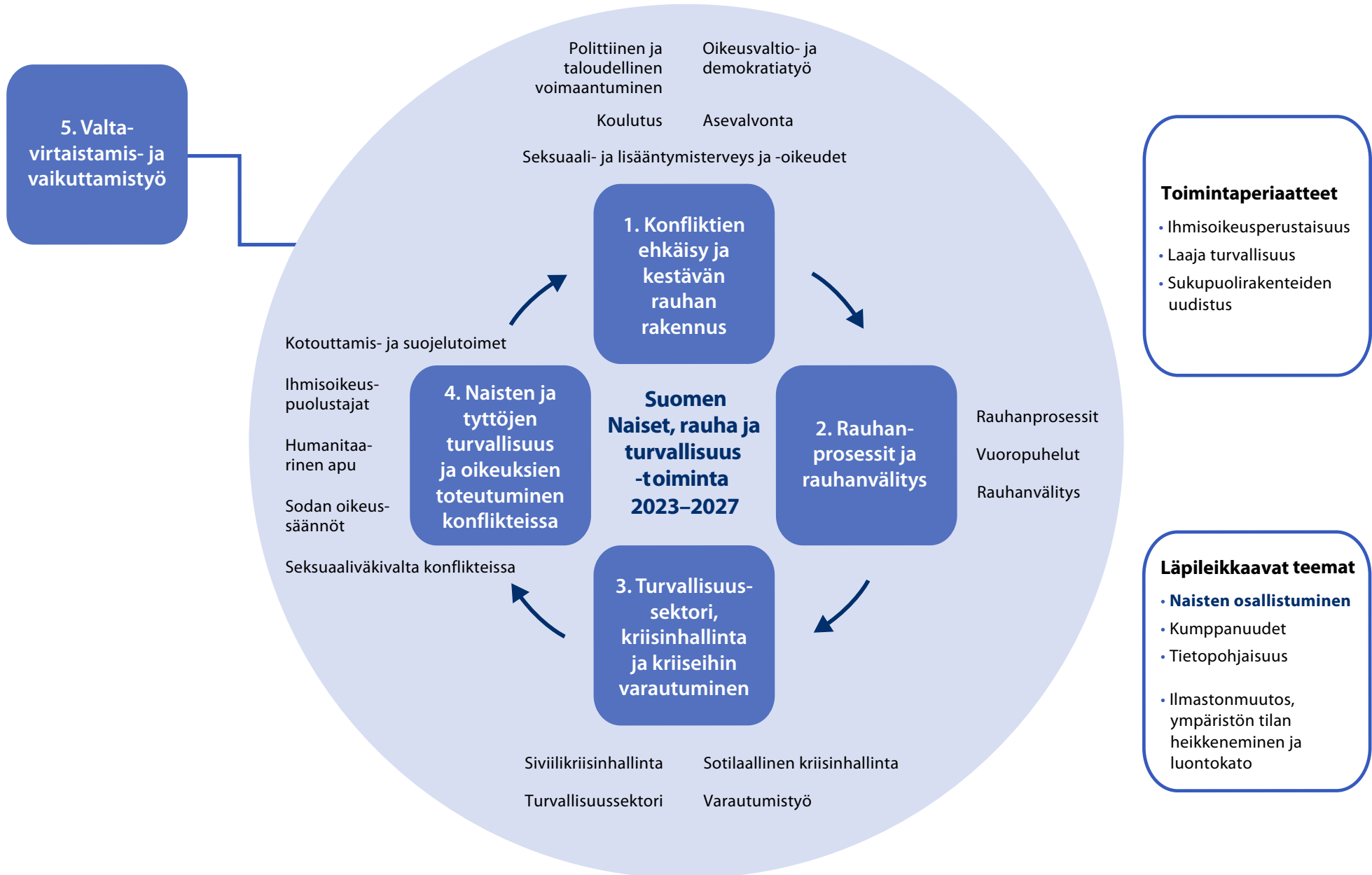
Kaavio 1. Suomen Naiset, rauha ja turvallisuus toiminta 2023–2027.