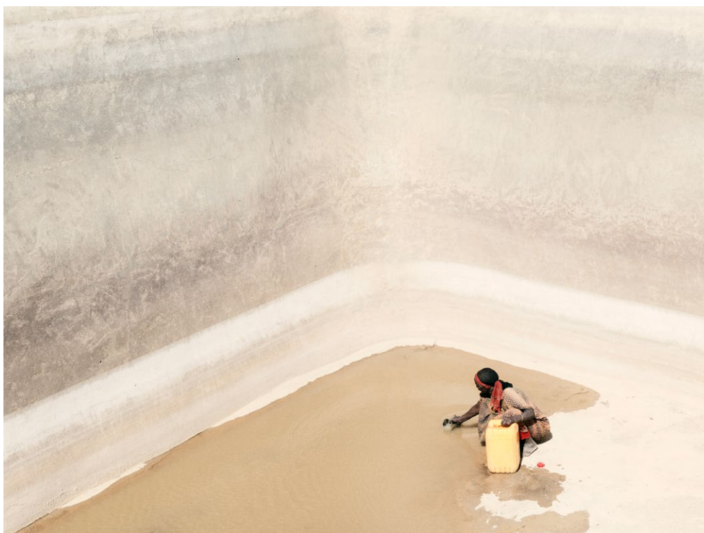
Kuva 6. Adar Aden asuu Hara Adanin kylässä. Hänellä ei ole vedensuodatinta eikä mahdollisuuksia puhdistaa vettä. Juomavetensä hän ottaa samasta altaasta, josta eläimet saavat vetensä.

Suomi edistää ja osallistuu aktiivisesti niin YK:ssa, EU:ssa kuin muillakin kansainvälisillä foorumeilla käytävään keskusteluun ilmasto- ja ympäristökysymysten vaikutuksista turvallisuuteen sekä etsii ratkaisuja niihin vastaamiseksi.