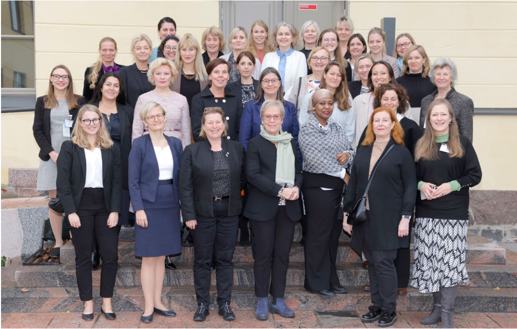
Kuva 9. Pohjoismaiden naisrauhavälittäjäverkosto kokoontui vuosittaiseen kokoukseensa Helsinkiin marraskuussa 2022. Kokouksessa keskusteltiin Euroopan turvallisuustilanteen muutoksesta, ja pohdittiin miten verkosto voisi tukea naisten poliittisen osallistumisen vahvistamista Ukrainassa.