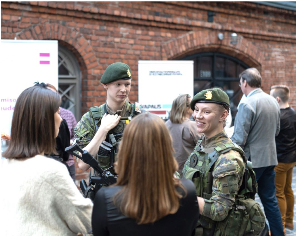
Kuva 12. Nuoret sotilaat Kriisinhallinta NYT-tapahtumassa marraskuussa 2022.

Tutkimusten mukaan perhesyyt ovat yksi keskeisimpiä syitä erityisesti naisten kriisinhallintauran päättymiselle, mikä heijastuu myös naisten mahdollisuuksiin edetä johtotehtäviin operatioissa. Suomi on kehittänyt kriisinhallintahenkilöstön läheisten tukitoimia, ja on mm. uudistanut siviilikriisinhallintaa koskevaa lainsäädäntöään siten, että perheiden rooli huomioidaan osin aiempaa paremmin. Tämän edistämiseksi Suomi osallistuu myös kansainvälisten järjestöjen linjausten kehittämiseen.