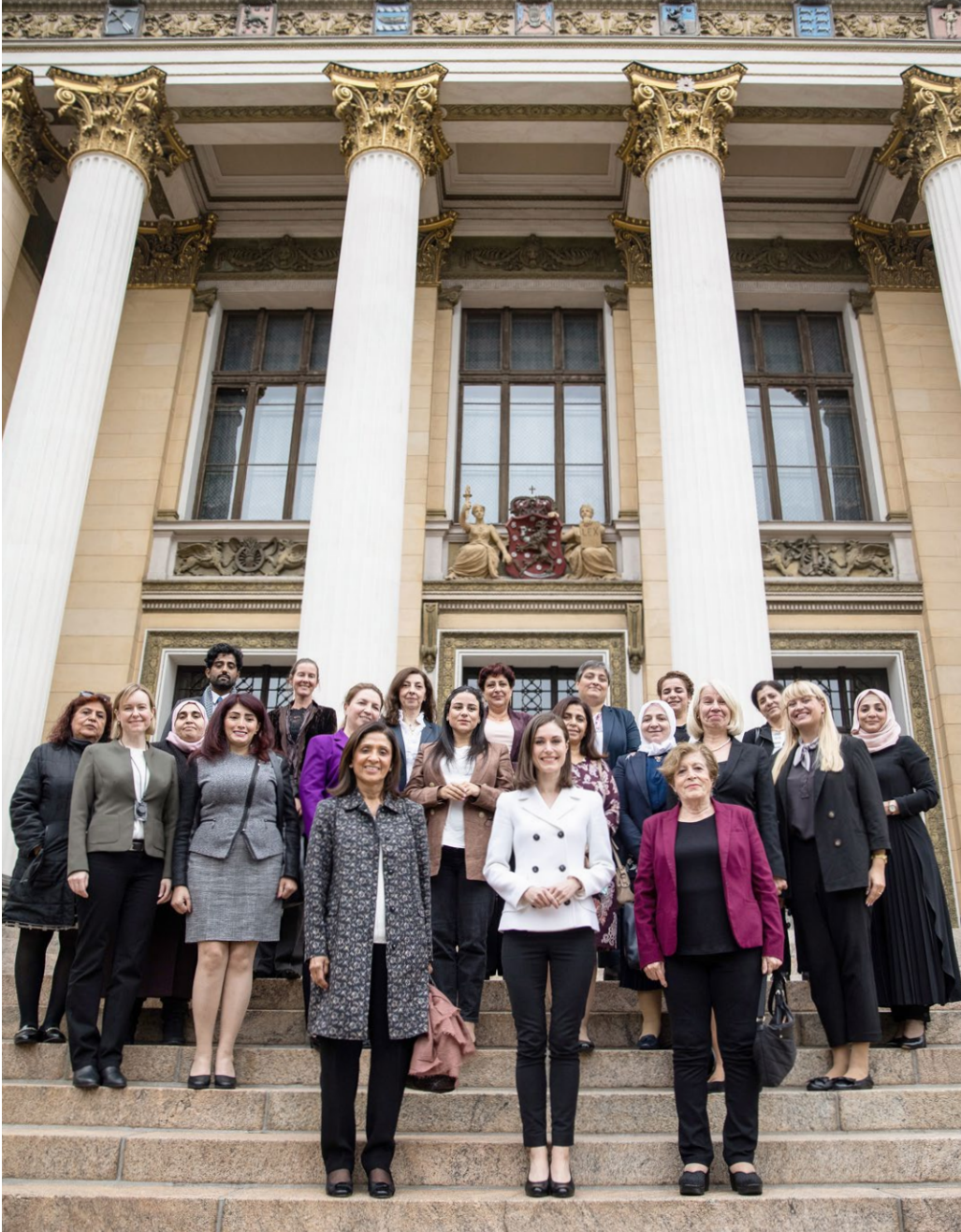
Kuva 4. Suomi emännöi YK:n syyrialaisnaisten neuvoo-antavan ryhmän (Women's advisory board, WAB) kokousta 2021. WAB on syyrialaisnaisten ryhmä, joka neuvoo YK:n pääsihteerin Syyria-erityisedustajaa hänen välittäessään poliittista ratkaisua Syyrian konfliktiin YK:n turvallisuusneuvoston päätöslauselma 2254:n mukaisesti. Ryhmän jäsenillä on vaihteleva sosioekonominen, poliittinen, kulttuurinen ja maantieteellinen tausta. Neuvonannossaan erityisedustajalle WAB ottaa huomioon naisten voimaannuttamisen ja oikeudet. Ryhmä vie eteenpäin syyrialaisnaisten erilaisia poliittisiin keskusteluihin liittyviä näkemyksiä. Suomi on tukenut WABin työtä sen alusta asti.