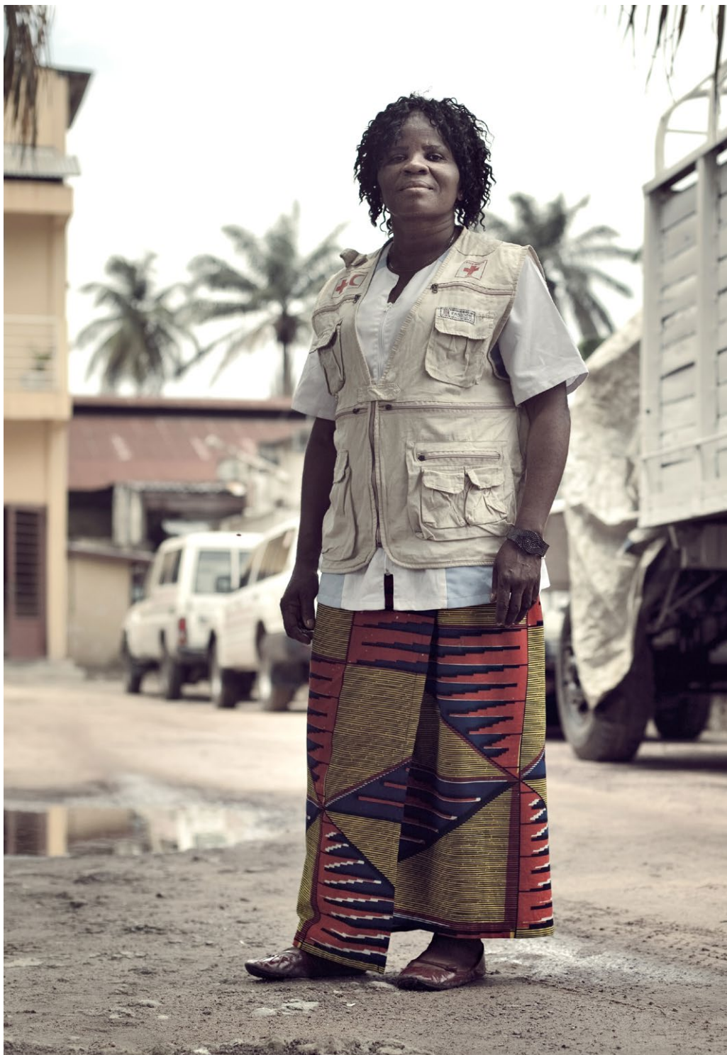
Kuva 14. Suomi korostaa naisten vapaata pääsyä humanitaarisiin tehtäviin. Kuvassa Punaisen Ristin (Red Cross of the Democratic Republic of the Congo) vapaaehtoinen Kinshasassa DRC:ssä.