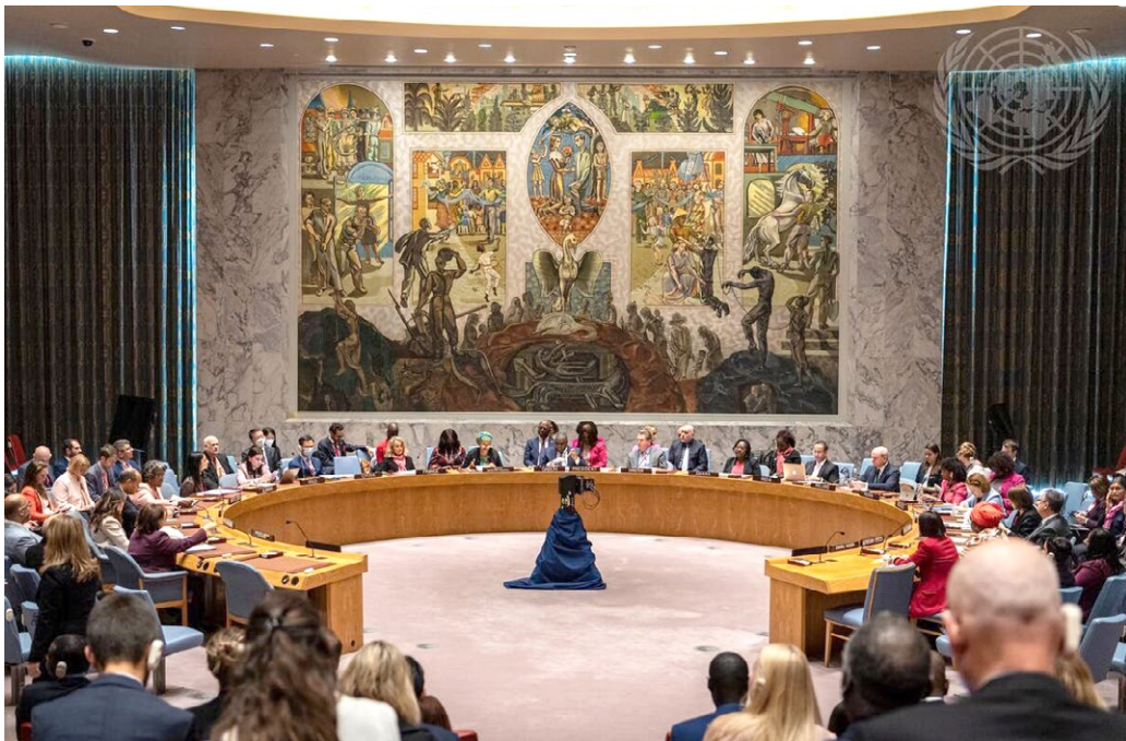
Kuva 1. YK:n turvaneuvoston Naiset, rauha ja turvallisuus -yleiskeskustelussa pääsihteeri julkistaa vuosittaisen raporttinsa päätöslauselman 1325 toimeenpanosta. Lokakuussa 2022 keskusteltiin naisten johtajuudesta.