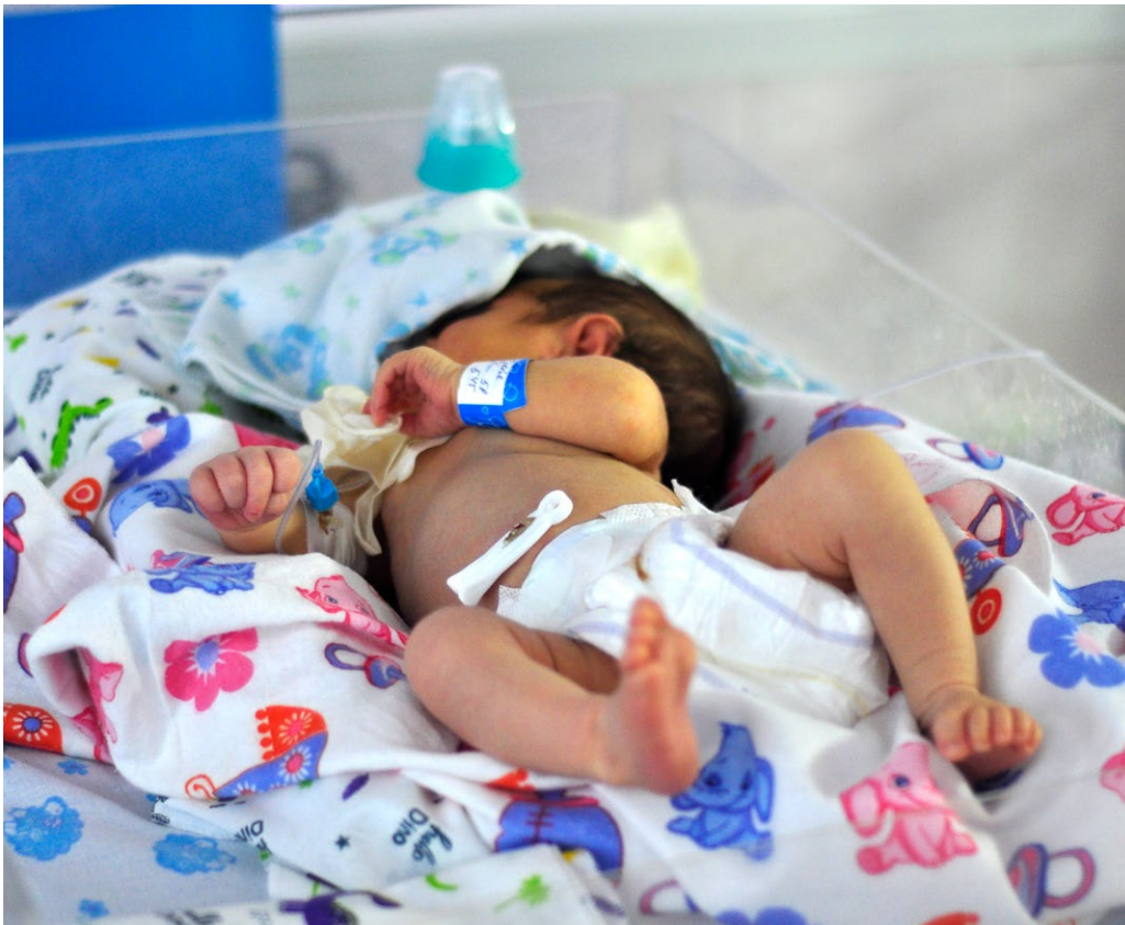
Kuva 8. Lahjoitukset sairaanhoitovälineistä ja suojavaarusteista tulevat kipeään tarpeeseen kiovalaisessa lastensairaalassa, jossa äitejä ja vastasyntyneitä hoidetaan pommitusten keskellä kellarissa.