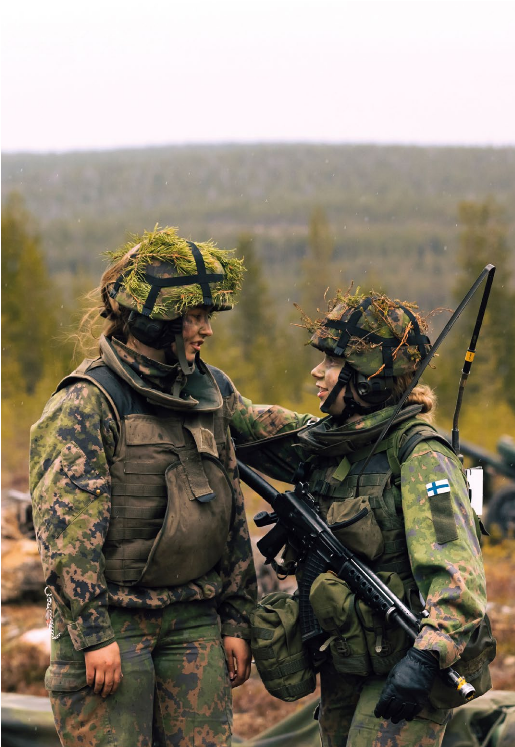
Kuva 11. Kiinnostus naisten vapaaehtoista asepalvelusta kohtaan on ollut viime vuosina kasvussa, ja palvelukseen hakeutuu vuosittain yli tuhat naista. Puolustusvoimat on kouluttanut vuosien varrella jo yli 10 000 naista reserviin.