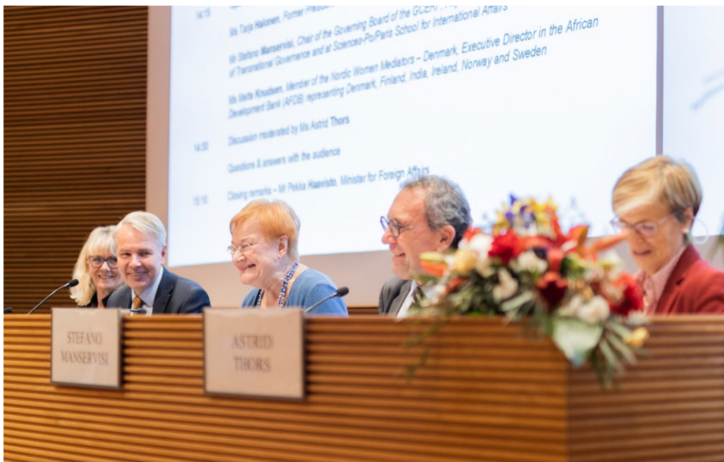
Kuva 15. Marraskuussa 2022 Helsingissä pidetyn Pohjoismaisen naisrauhanvälittäjäverkoston vuosikokouksen yhteydessä järjestetyssä paneelikeskustelussa ”Navigating peace in the current global security environment” keskusteltiin muuttuneen globaalien turvallisuusympäristön vaikutuksista rauhanvälitykseen ja rauhan edistämiseen.

Suomi vahvistaa Naiset, rauha ja turvallisuus -agendaan liittyvän tutkimuksen ja käytännön työn yhteyttä, sekä tietoon perustuvaa päätöksentekoa hyödyntäen erityisesti Suomessa tuotettavaa tutkimusta ja tietoa. Suomi pyrkii vahvistamaan tutkimusinstituuttien ja ajatushautomoiden tiedonvaihtoa ja vahvistamaan yhteyksiä viranomaisiin Naiset, rauha ja turvallisuus -tutkimustiedon levittämiseksi.