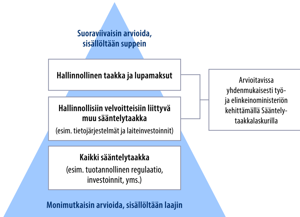
Kuvio 1. Sääntelytaakan eri tasot taakkavaikutusten arvioinnissa

Vaikka Yksi yhdestä -periaatteen tavoitteena on ollut kattaa kaikki suorat sääntelytaakka-vaikutukset, euromääräistä arviointia on käytännössä kyetty systemaattisesti laatimaan hallinnollisten taakkojen (sis. mm. kirjanpito-, tiedonanto- ja raportointivelvoitteet), lupamaksujen sekä hallinnollisiin velvoitteisiin suoraan liittyvien aineellisten noudattamiskustannusten osalta. Sen sijaan suoraan tuotannollisia prosesseja ja investointeja sääntelevät velvoitteet ovat osoittautuneet vaikeiksi arvioida uskottavasti ja yhdenmukaisesti, vaikkakin ne usein ovat taloudellisilta vaikutuksiltaan merkittävimpiä (ks. kuvio 1). Sen sijaan esimerkiksi verojen, sakkojen, hallinnollisten seuraamusmaksujen, sopimusehtojen noudattamiskustannusten ja palkansaajakompensaation ei katsota kuuluvan sääntelytaakan käsitteeseen.